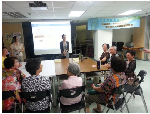
里民對於改造內容互相討論分享