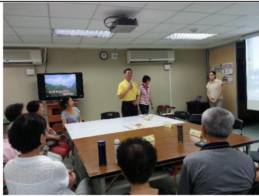
里長現場主持及說明會議內容