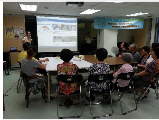
規劃單位解說改造事項及方案