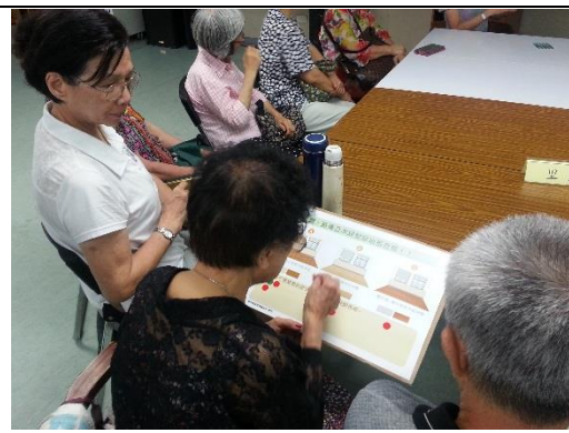
里民針對議題討論及投票表決