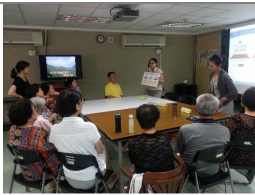
與里民討論設計方案及提議