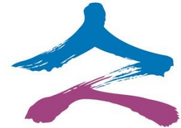
臺北市中正區公所 Zhongzheng District Office, Taipei City

※簡捷的毛筆寫意表現一氣呵成，輔以藍紫色系的運用，展現出匯集了傳統及現代的精神，更突顯區內的文藝氣息，有如『歷史人文堡壘，融入現代精神；為民服務為標，民安居樂為旨』。