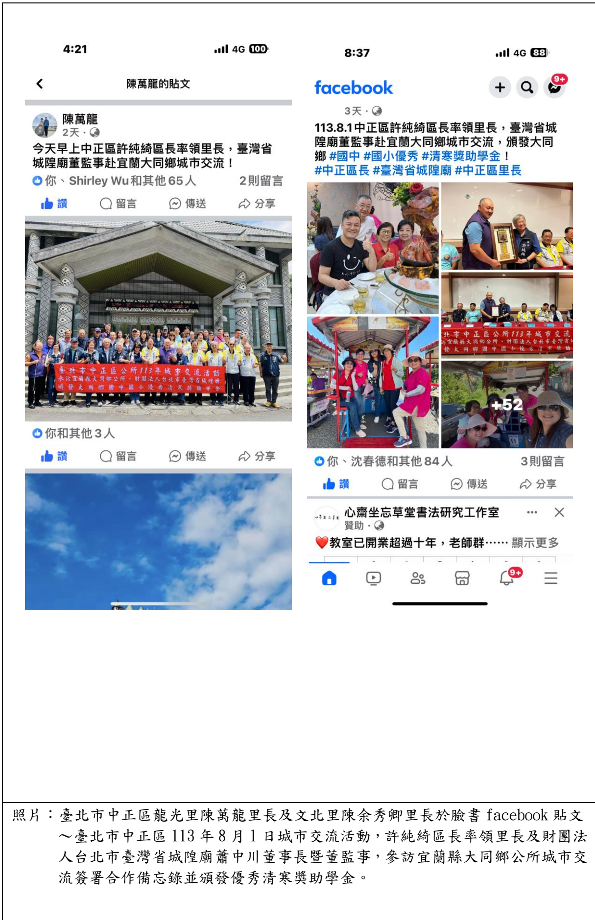
照片：臺北市中正區龍光里陳萬龍里長及文北里陳余秀卿里長於臉書 facebook 貼文～臺北市中正區 113 年 8 月 1 日城市交流活動，許純綺區長率領里長及財團法人台北市臺灣省城隍廟蕭中川董事長暨董監事，參訪宜蘭縣大同鄉公所城市交流簽署合作備忘錄並頒發優秀清寒獎助學金。