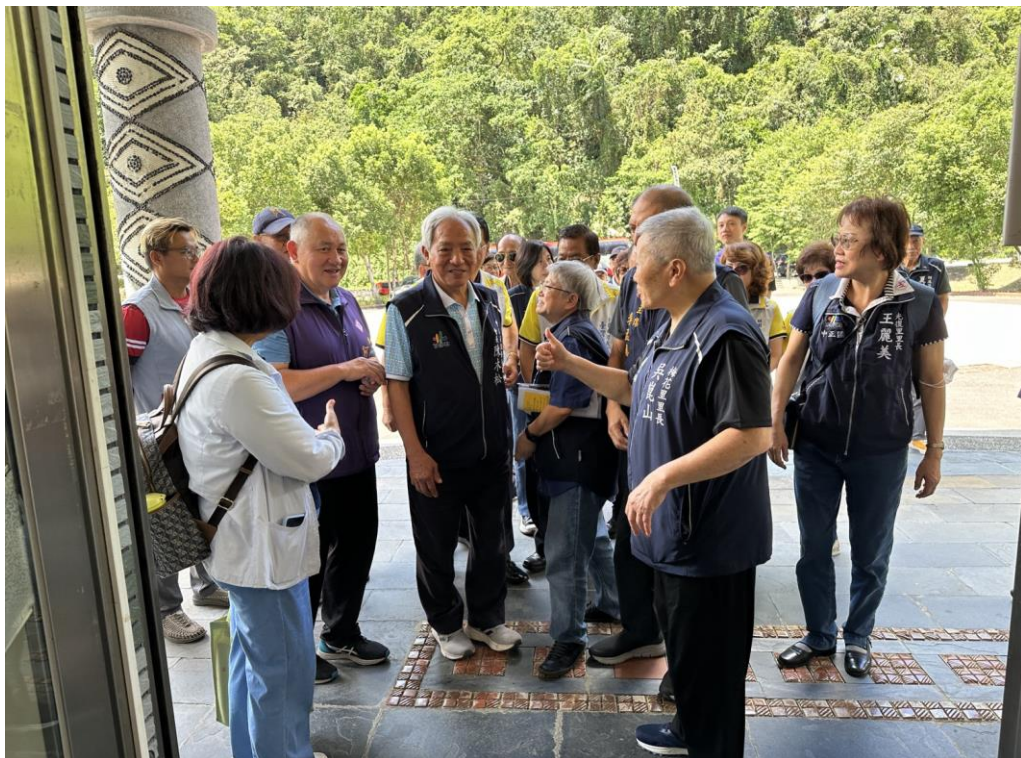
照片：臺北市中正區公所113年8月1日城市交流活動--參訪宜蘭縣大同鄉公所。 財團法人台北市臺灣省城隍廟頒發宜蘭縣大同鄉國中國小優秀清寒獎助學金。