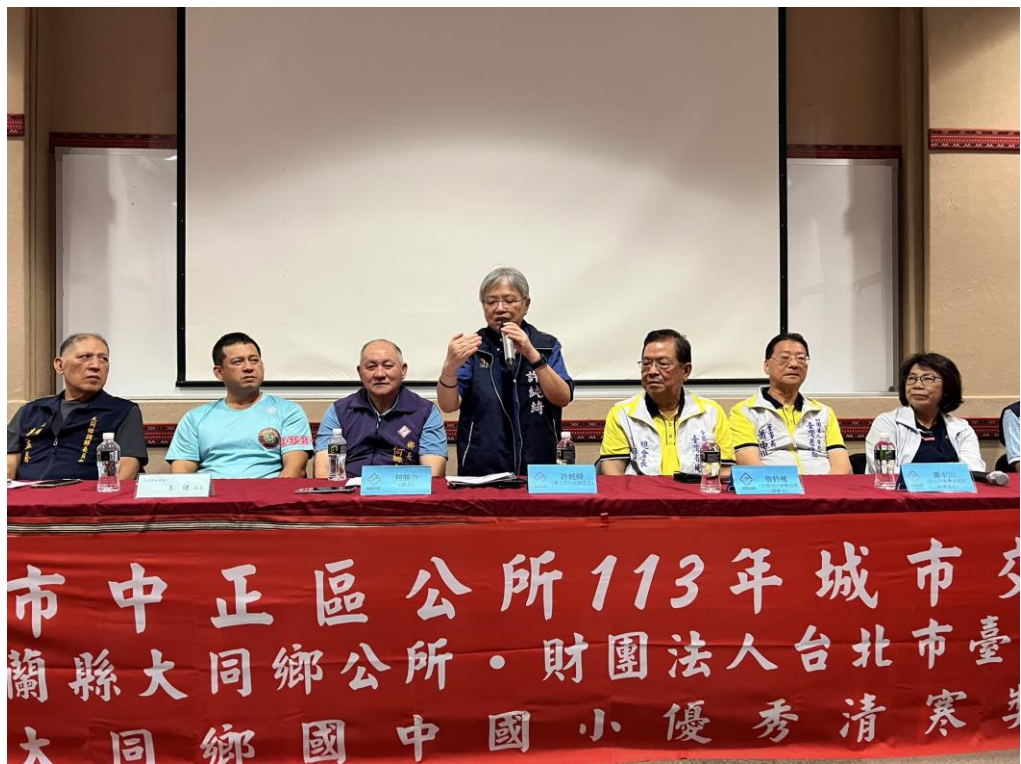
照片：宜蘭縣大同鄉公所何勝立鄉長致歡迎詞