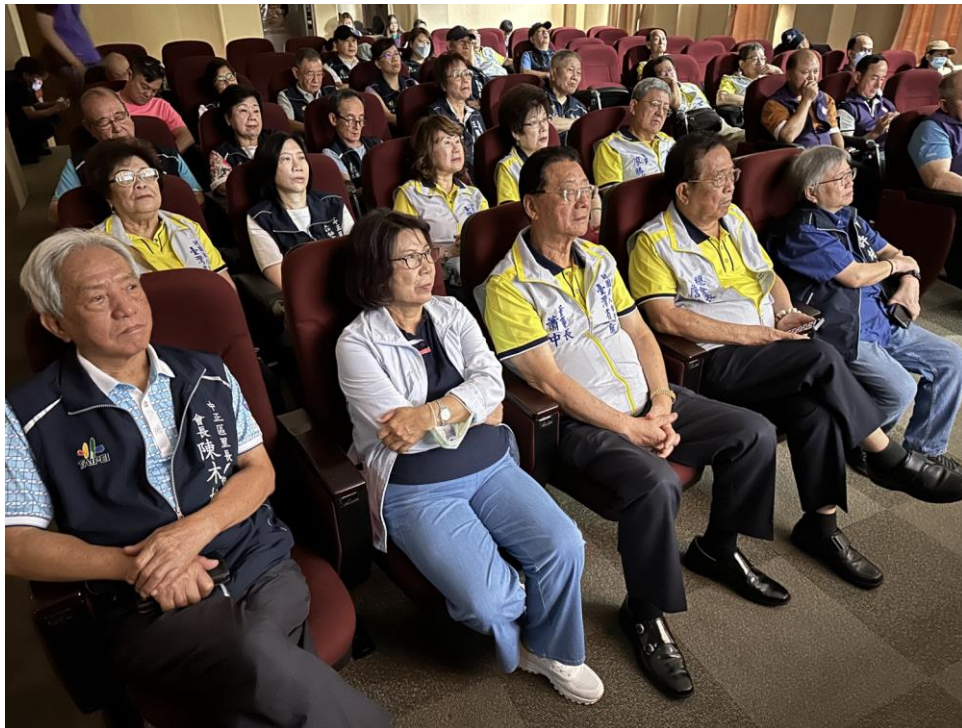
照片：臺北市中正區公所許純綺區長-中正區簡介 歷史沿革、地理環境、文教概況、人口統計、工商概況、醫療保健、中正區 特色商圈及財團法人台北市臺灣省城隍廟擴大舉辦北臺灣媽祖文化節等。