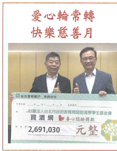
愛心輪常轉 快樂慈善月

的ETF(指數股票型基金)交付信託，由受託銀行將信託產生的現金股利、股票股利依指定比例撥付孳息給認助清寒學生基金會。