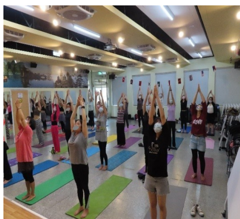
學員施做雙手合掌或分開高舉