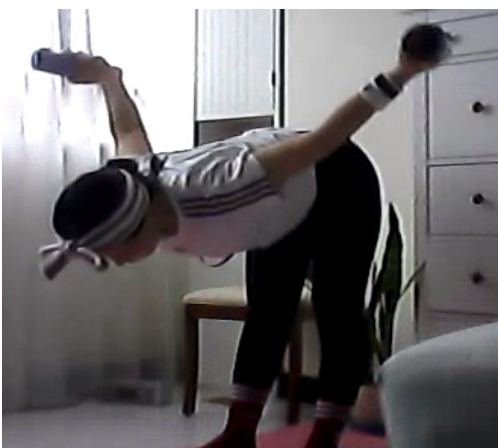
學員操作雙臂舉啞鈴