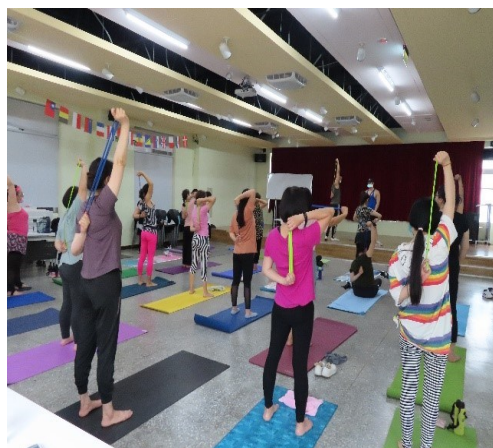
講師教授彈力帶使用注意事項