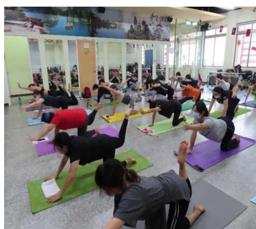
學員操作四柱支撐