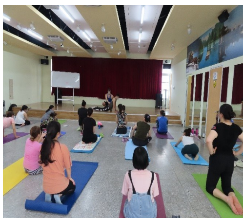
講師示範胸肌、三頭肌鍛鍊方式