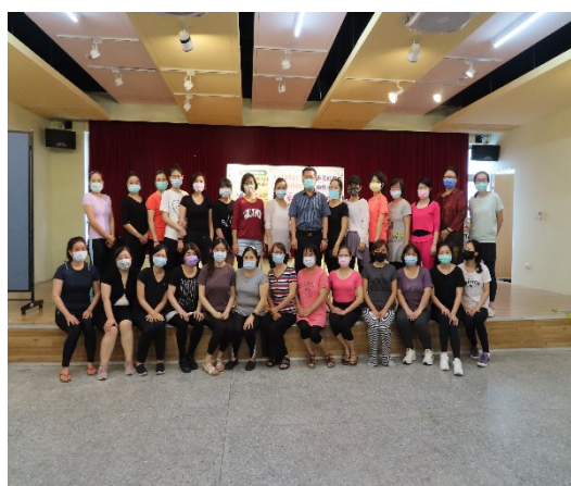
始業式區長與學員合照