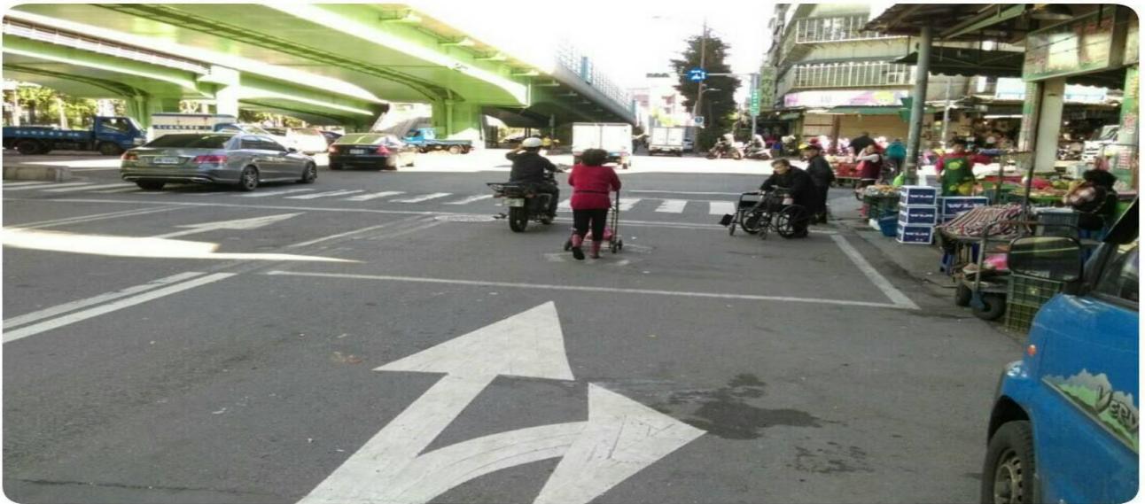
環南市場改建期間、市場週邊交通狀況圖