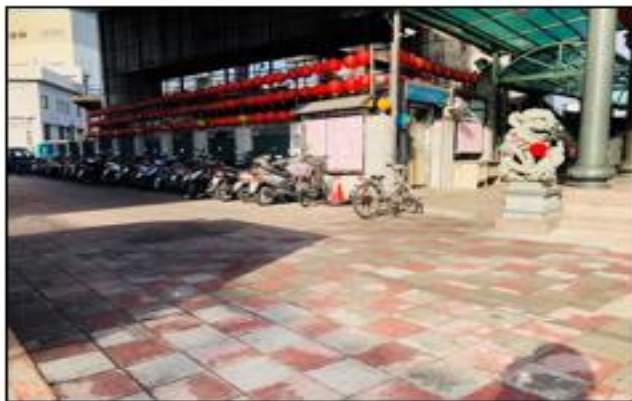
環南市場改建期間、市場週邊交通狀況圖