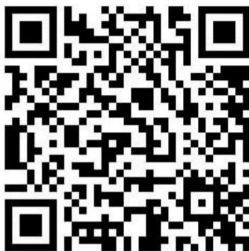
合約醫療院所名單 QR CODE

臺北市為照顧原住民族市民的健康，自 108 年 5 月 1 日起，擴大開放設籍北市 55-64 歲原住民族長者免費接種 1 劑 23 價肺炎鏈球菌疫苗，衛生局已於 4 月底起陸續針對符合資格之原住民族市民朋友寄送明信片通知，收到通知的市民朋友可攜帶「催種明信片」或「原住民族身分證明文件」(二擇一)、「身分證」及「健保卡」至臺北市 208 家肺炎鏈球菌疫苗合約醫療院所接種。