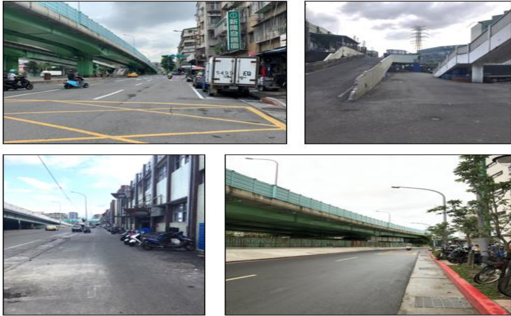
環南市場改建期間、市場週邊交通狀況圖