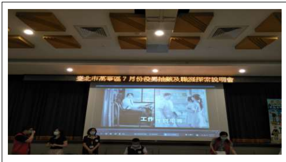
役男抽籤宣導教育性別平等