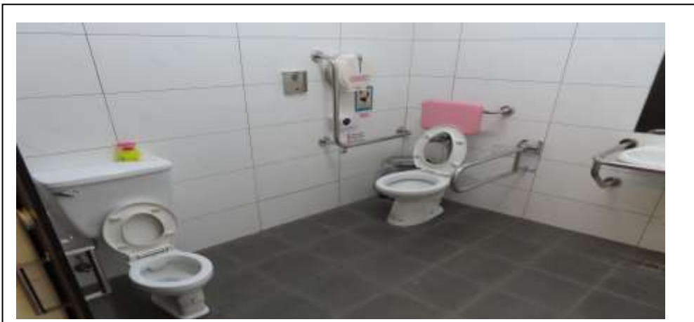
優先考量設有性別友善設施