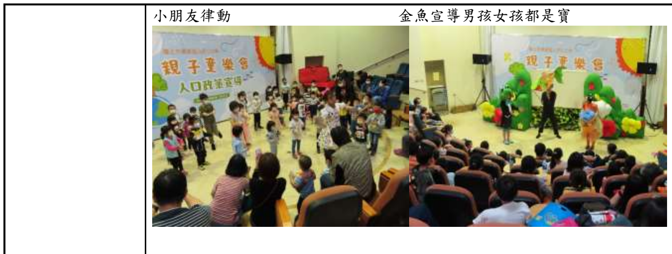
推展性別平等工作策略及具體措施類別及項目執行情形表