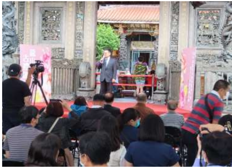
參加成年禮活動禮生、家長及來賓