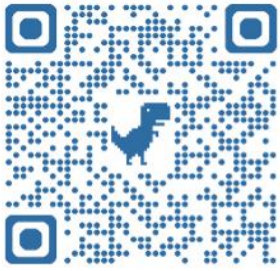
都市更新處官方網站