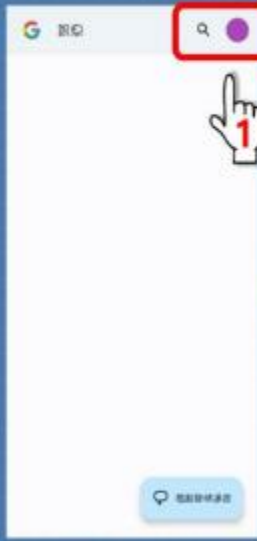
步驟1：進入帳戶設定