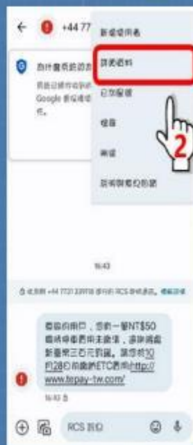
步驟2：前往詳細資料