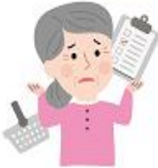
無法勝任原熟悉事務