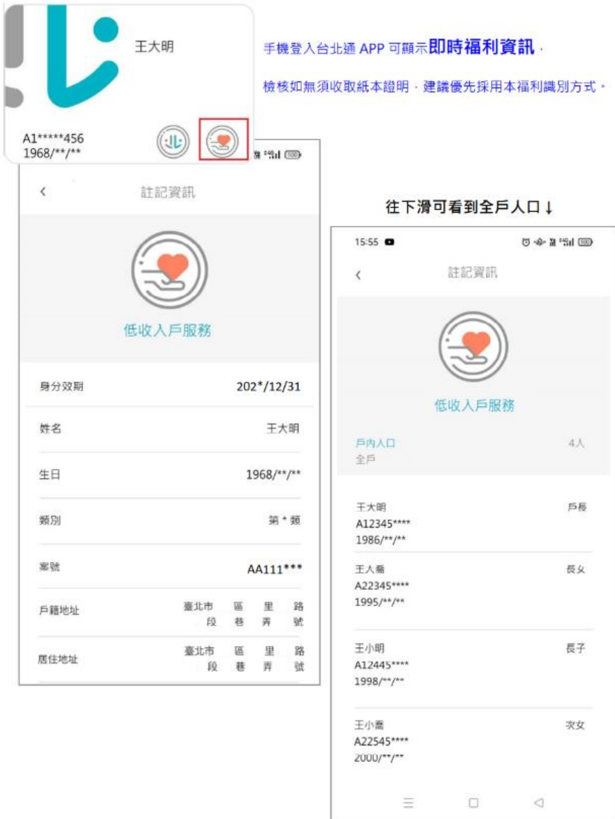
圖 6—台北通 APP 低收入戶及中低收入戶福利註記畫面