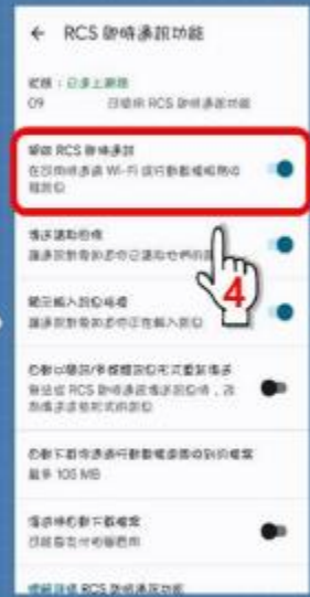
步驟4：關閉通訊功能