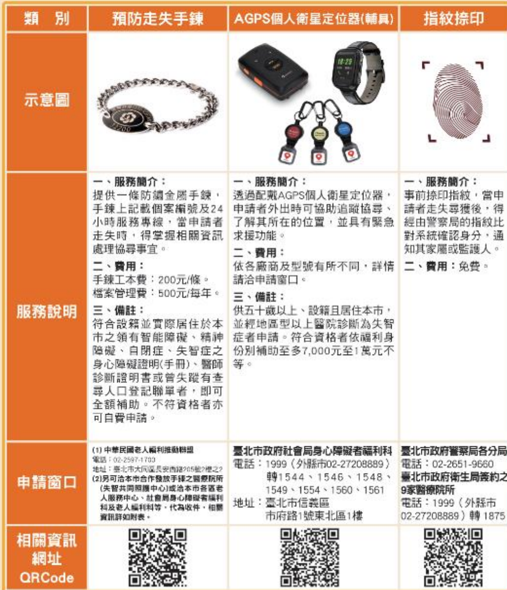
圖 12—預防走失服務資源表