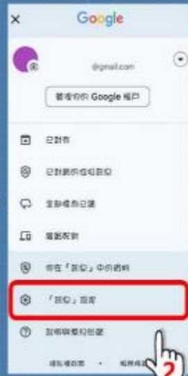
步驟2：前往訊息設定