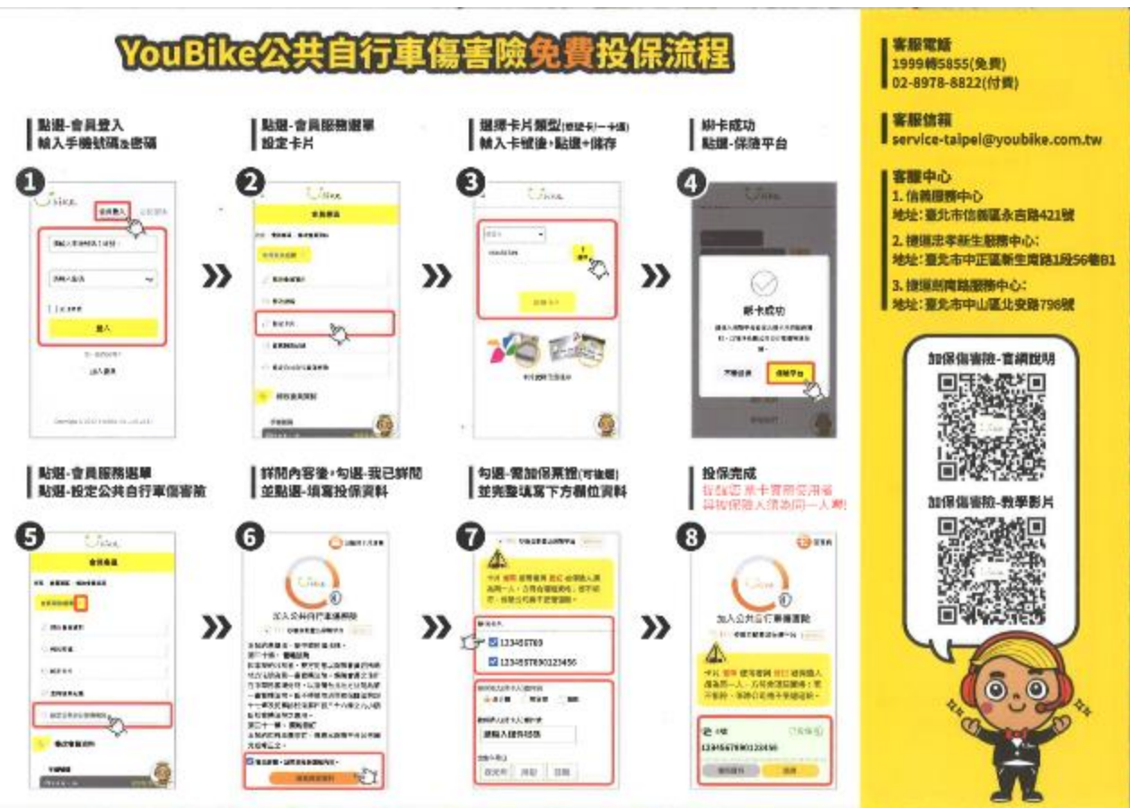
圖9-註冊 YouBike 會員及傷害險免費投保流程