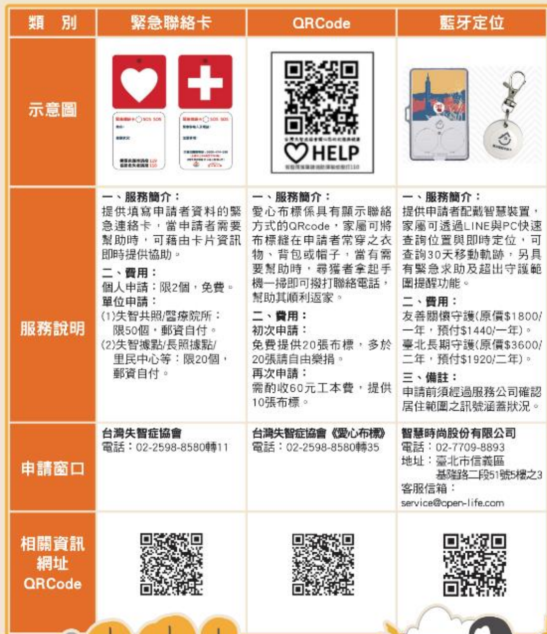
圖 12—預防走失服務資源表