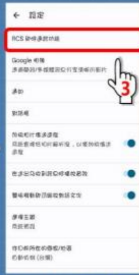
步驟3：點選RCS即時通訊