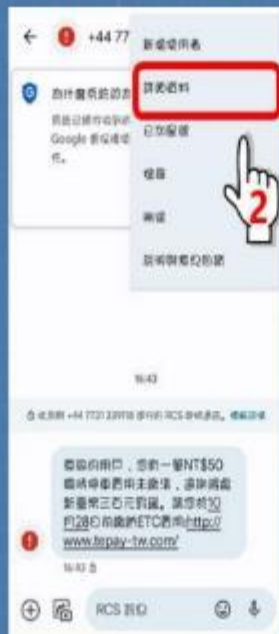
步驟2：前往詳細資料