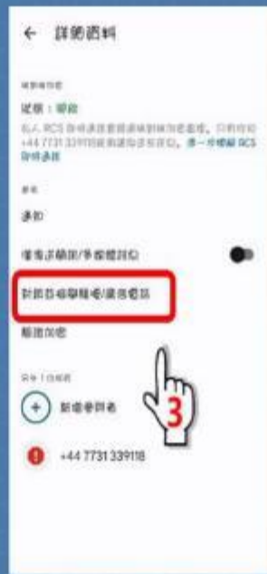
步驟3：設定封鎖並檢舉