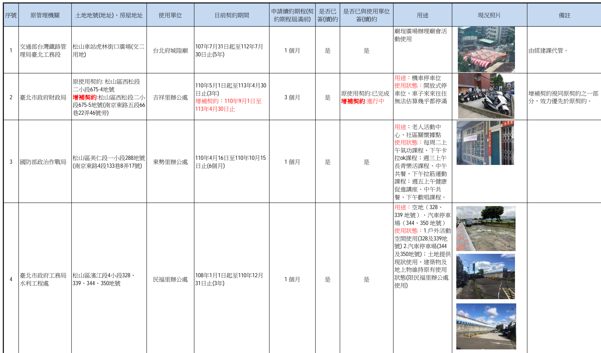
松山區公所代管國有、市有房地列管表