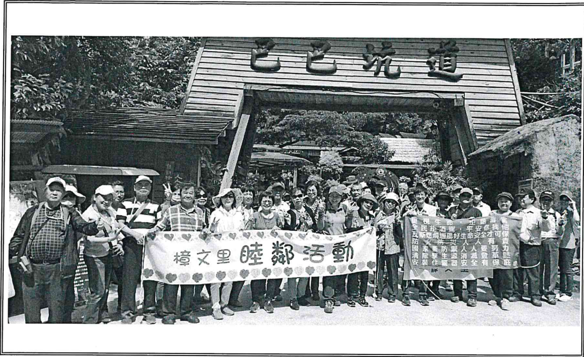
說明：於巴巴坑道休閒礦場合影