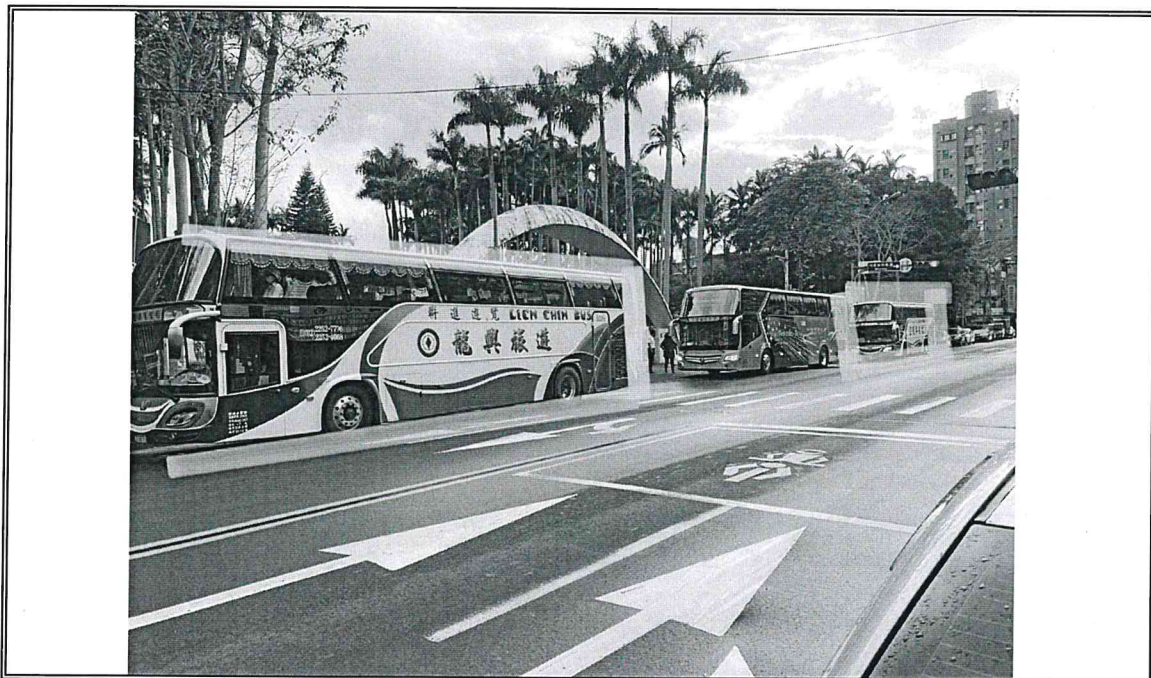
說明：活動當日 2 部遊覽車