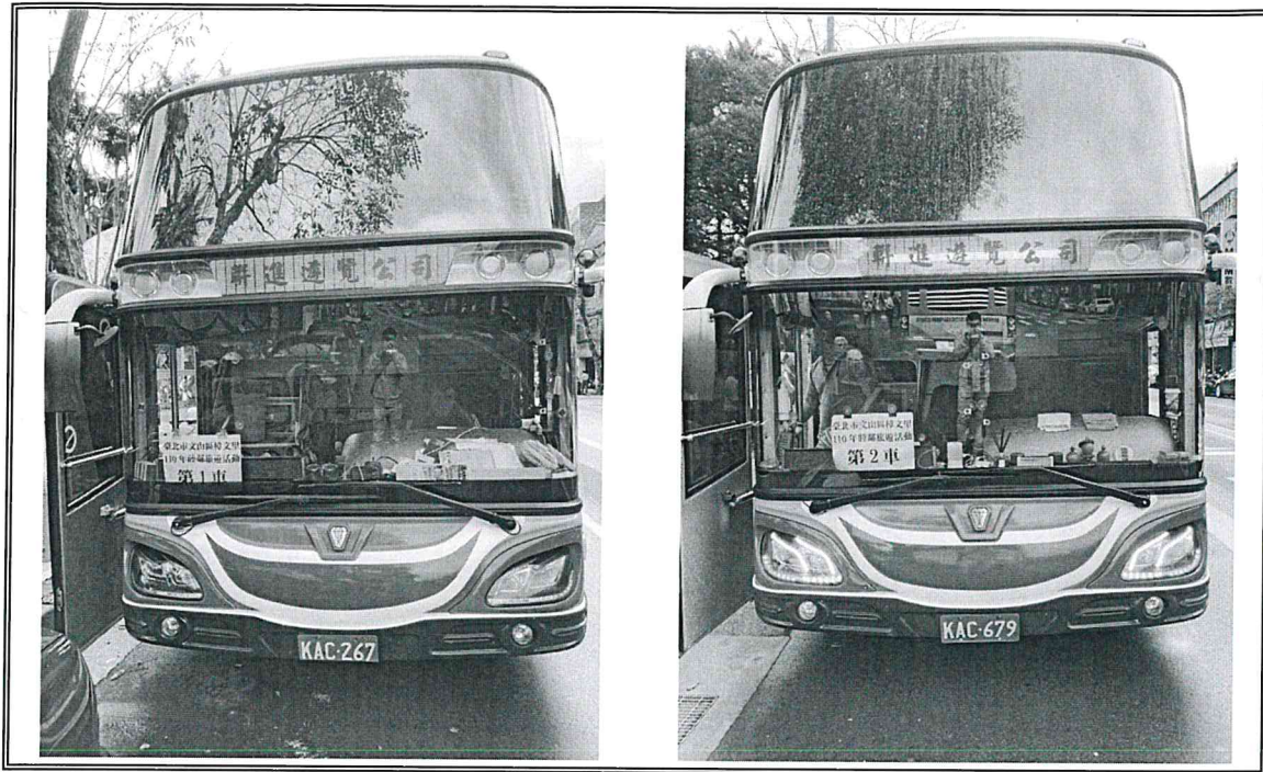
說明：第一車 KAC-267 第二車 KAC-679