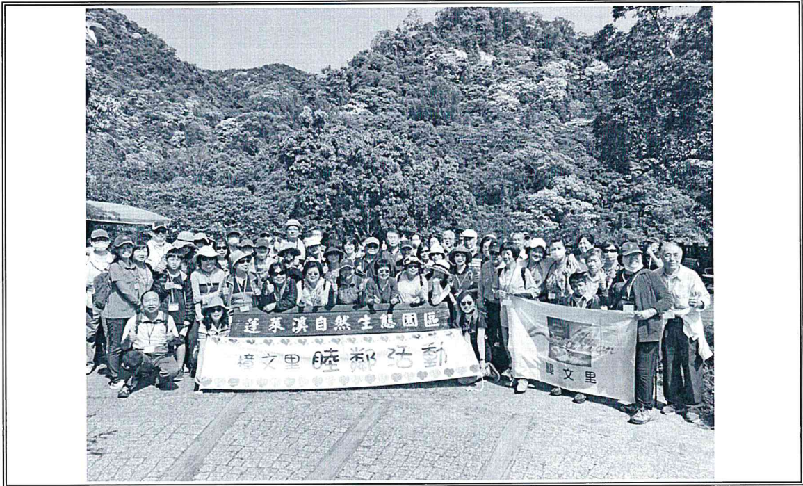
說明：於蓬萊溪護魚步道合影