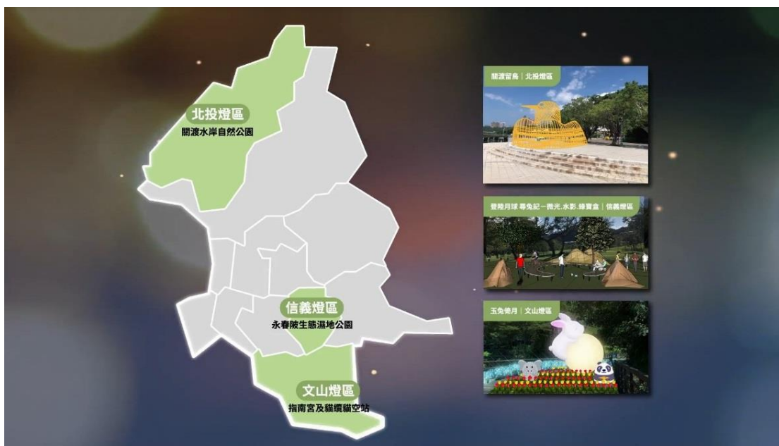
【自然生態】北投、信義、文山燈區