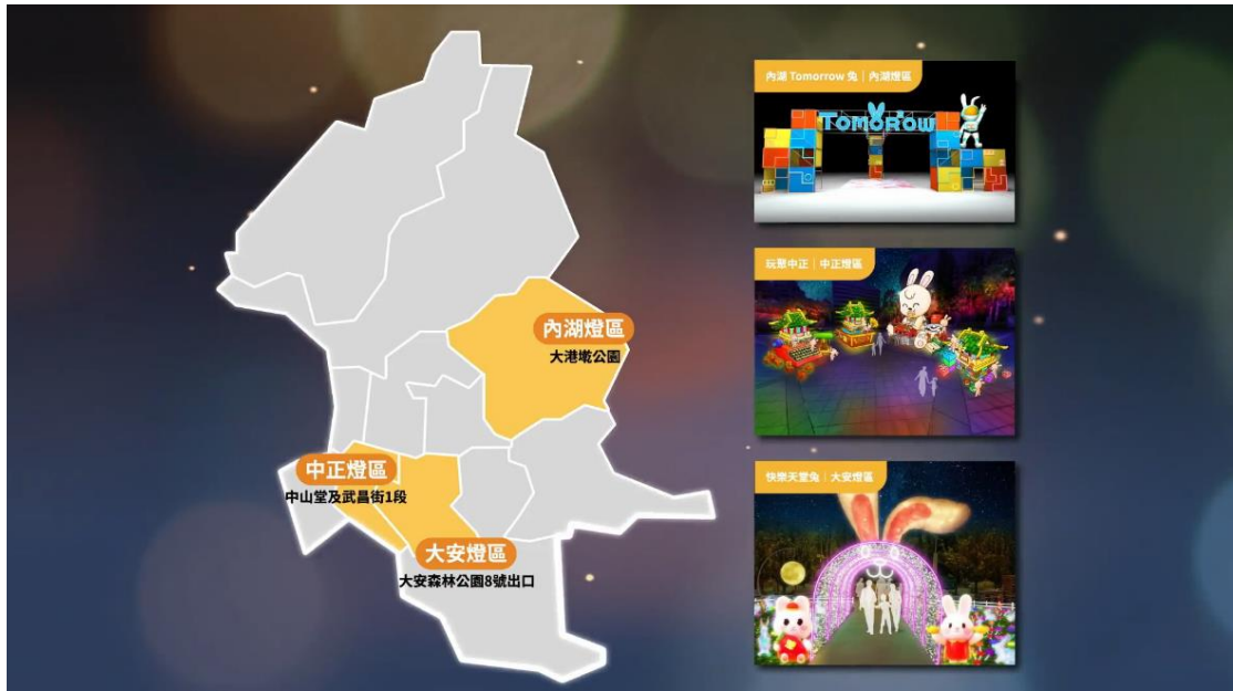
【人文特色】中正、大安、信義燈區