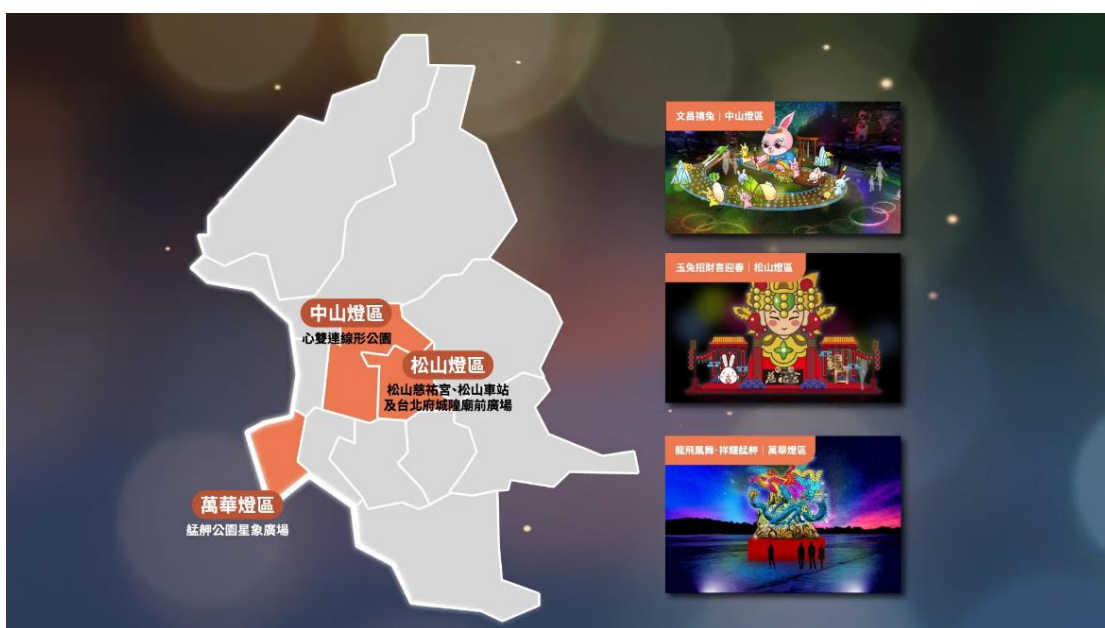
【宗教民俗】萬華、中山、松山燈區