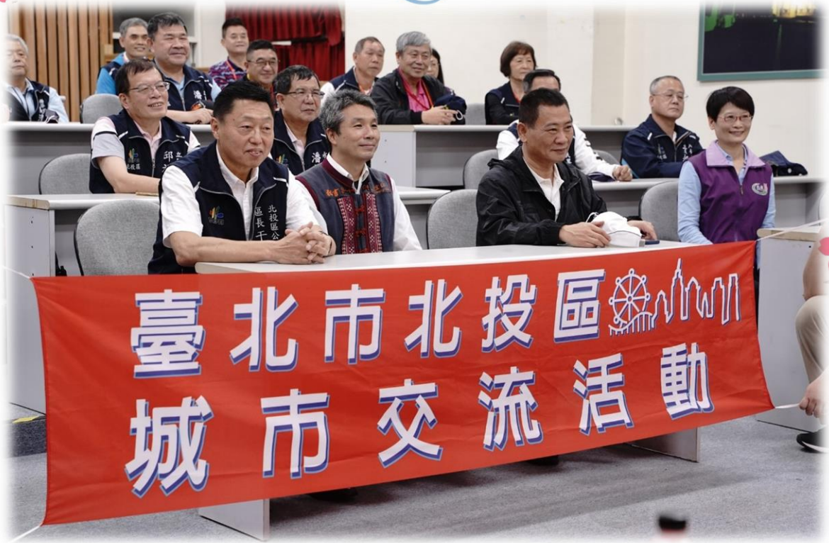
城市交流雙方進行合照。