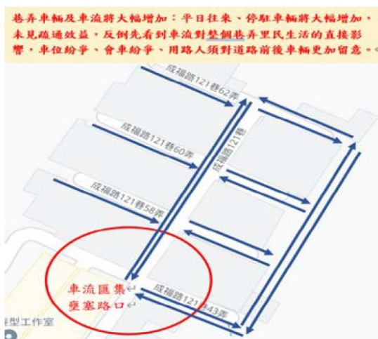
圖一、成福里 121 巷新闢道路車流分布圖