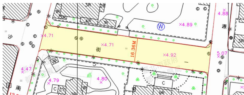
範例 2、單一路段，包含 2 筆以上地號