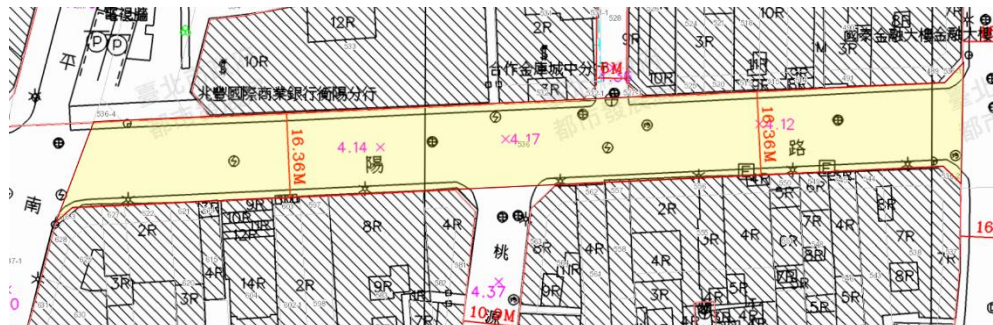
範例 4、多段路段，包含 2 筆以上地號