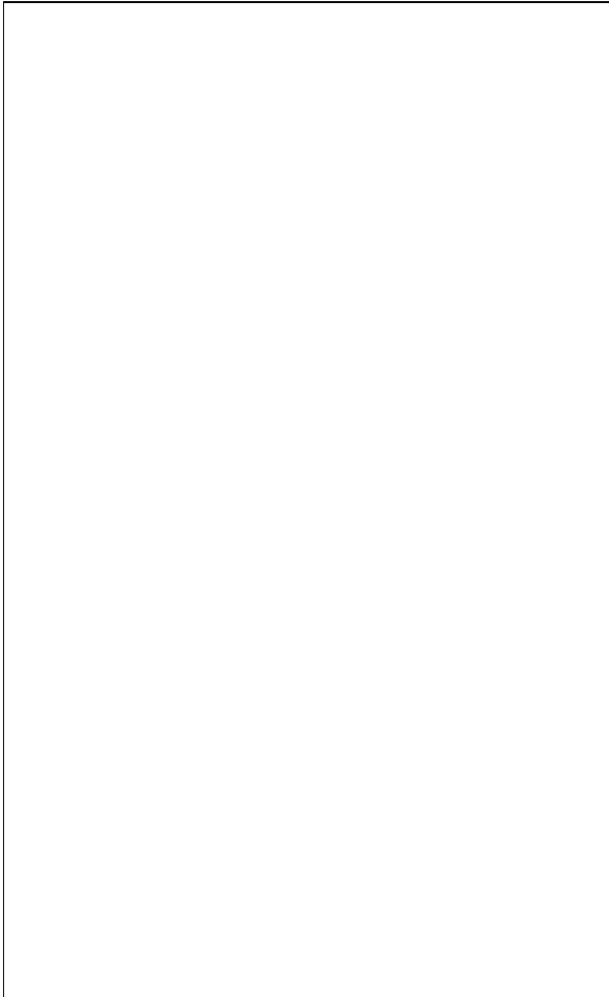
人行地下道或人行天橋位置圖