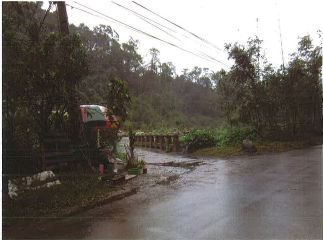
大湖段四小段 54、55、57、58 地號