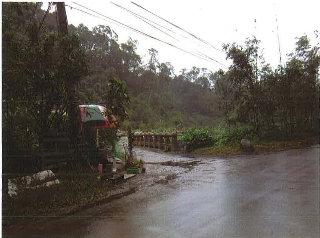
大湖段四小段 54、55、57、58 地號