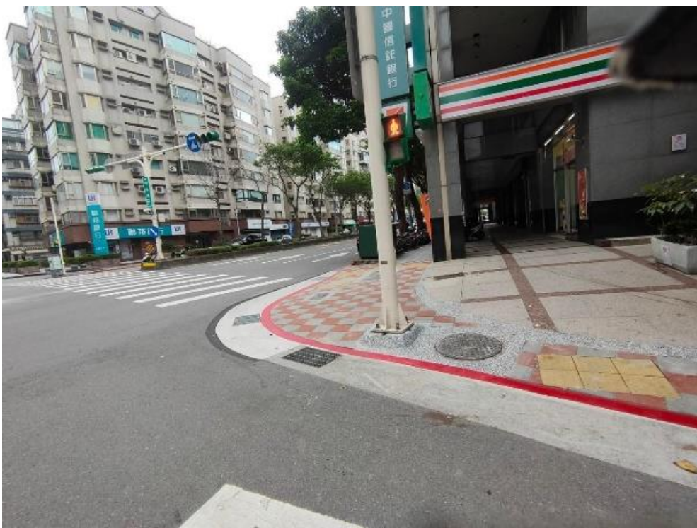
斜坡道更新工程施作標準圖