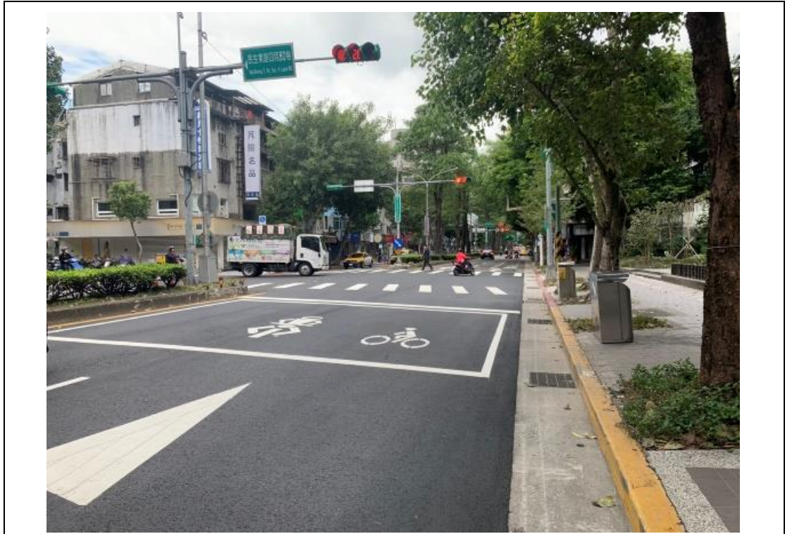
溝蓋銜接更新工程施作標準圖