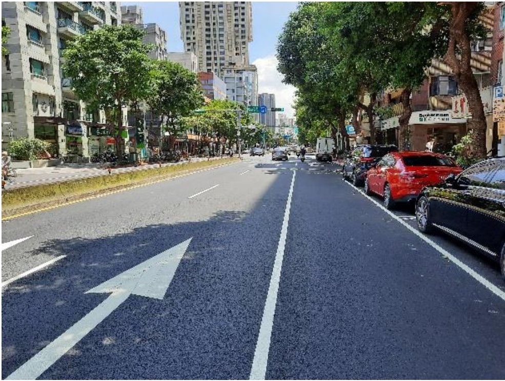
道路銑鋪後更新工程施作標準圖(1)