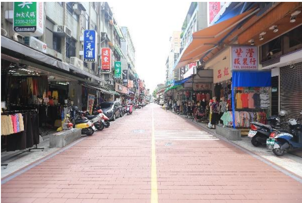
瀝青彩色壓花鋪面 面磚鋪設更新工程施作標準圖(1)