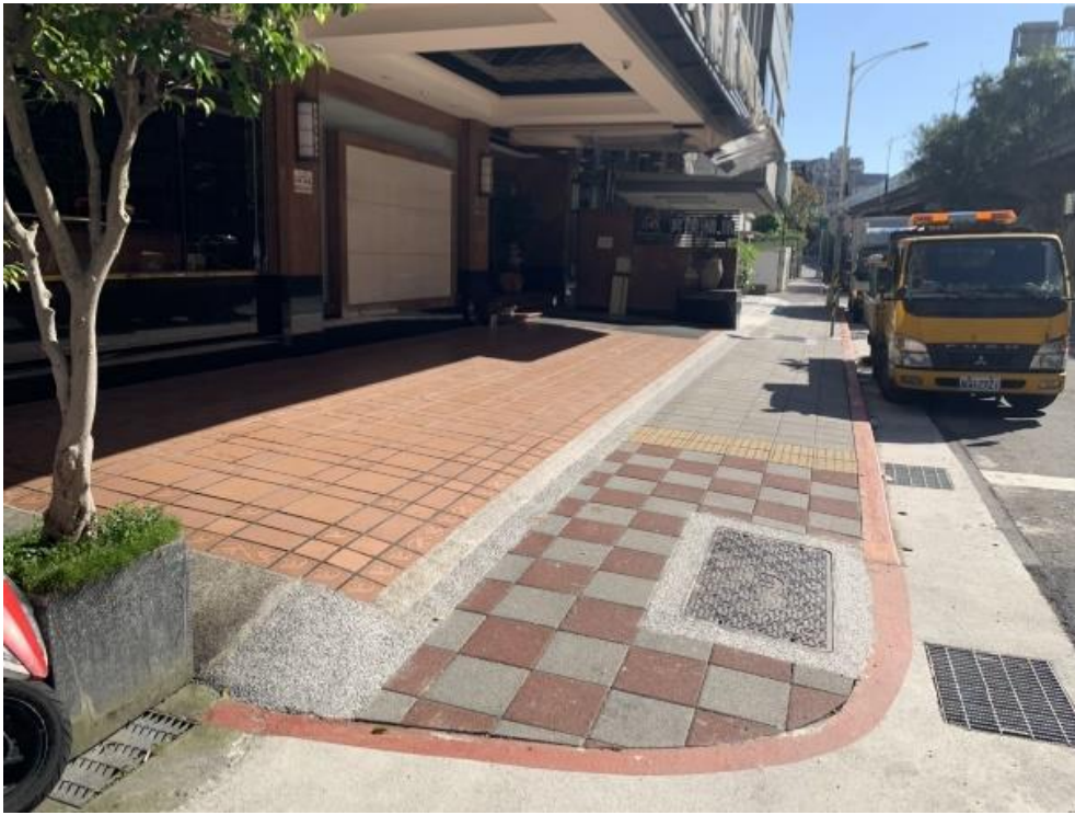
人手孔更新工程施作標準圖