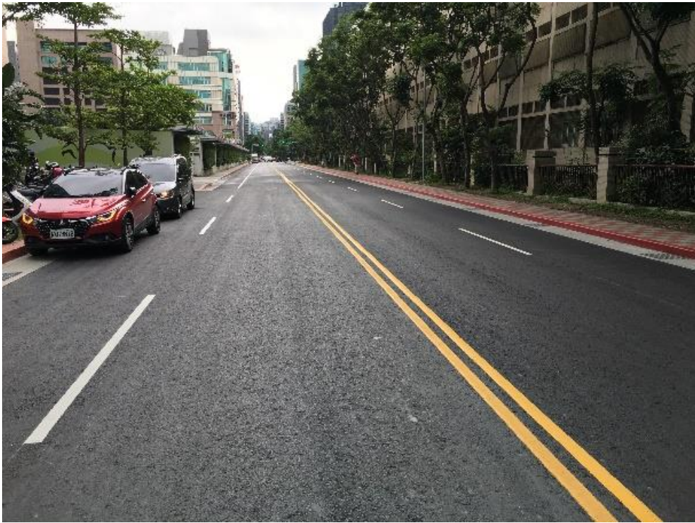
道路銑鋪後更新工程施作標準圖(2)