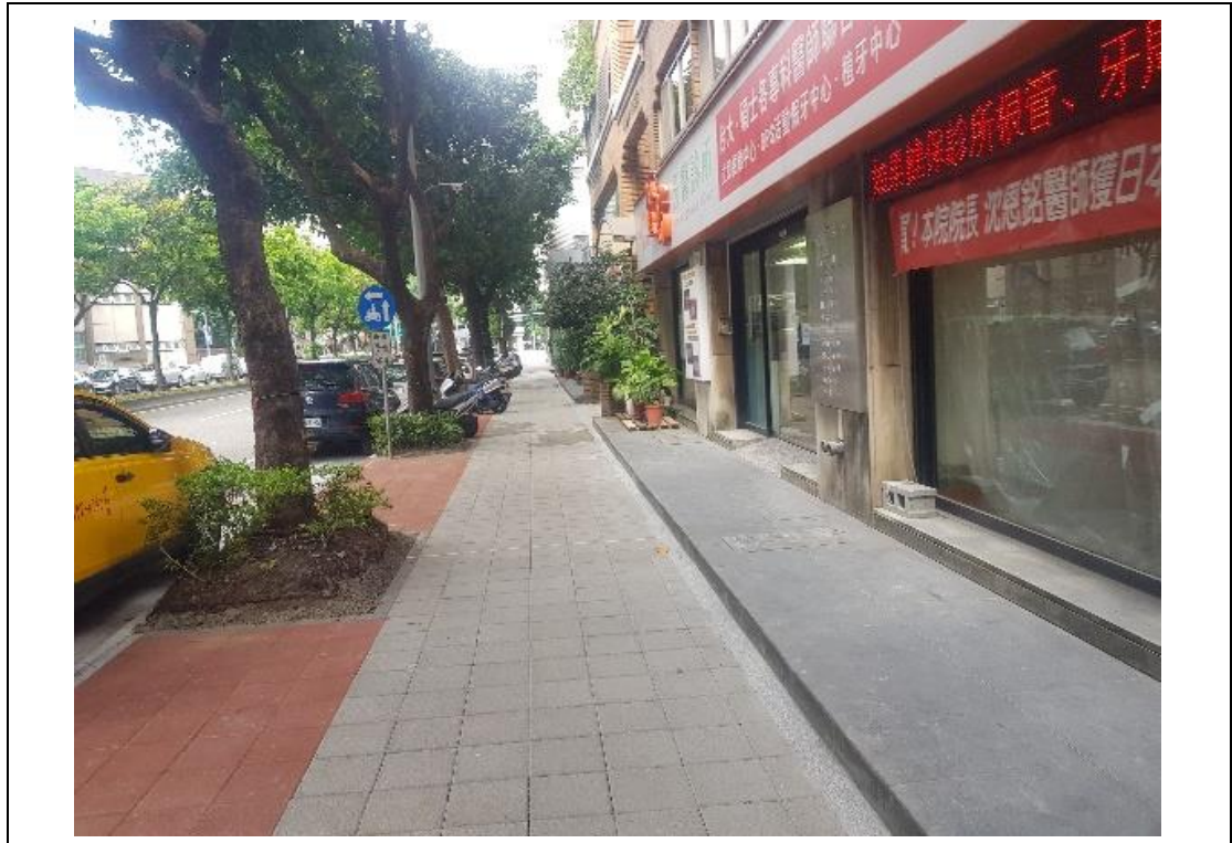
樹穴及鋪面更新工程施作標準圖