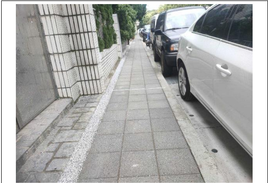
路緣石更新工程施作標準圖