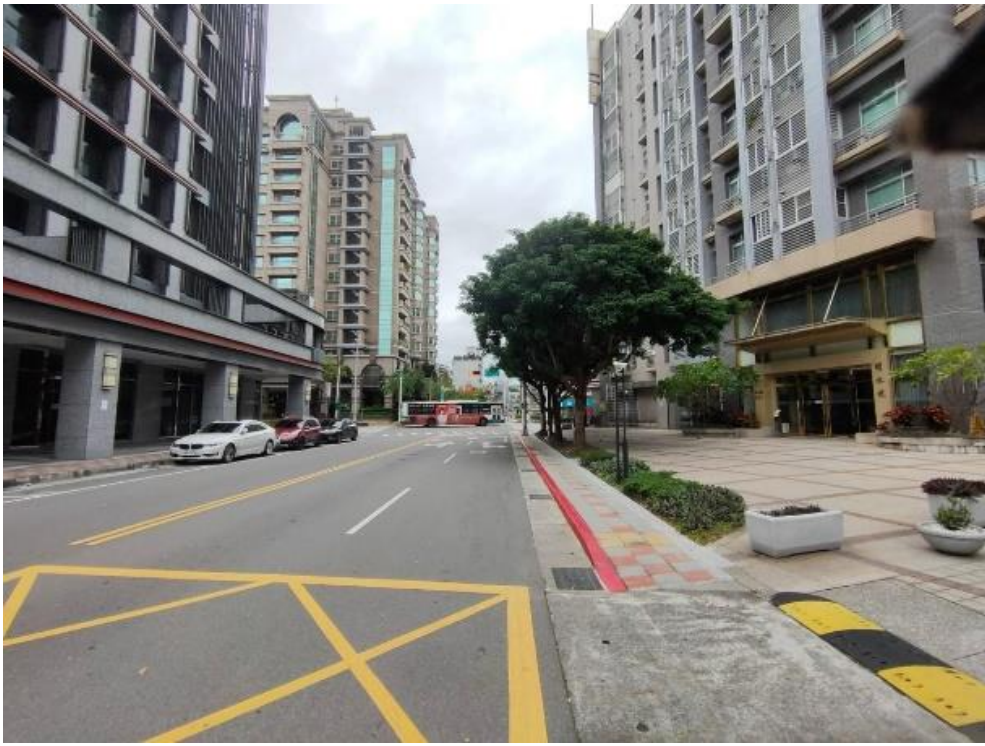
側溝蓋更新工程施作標準圖