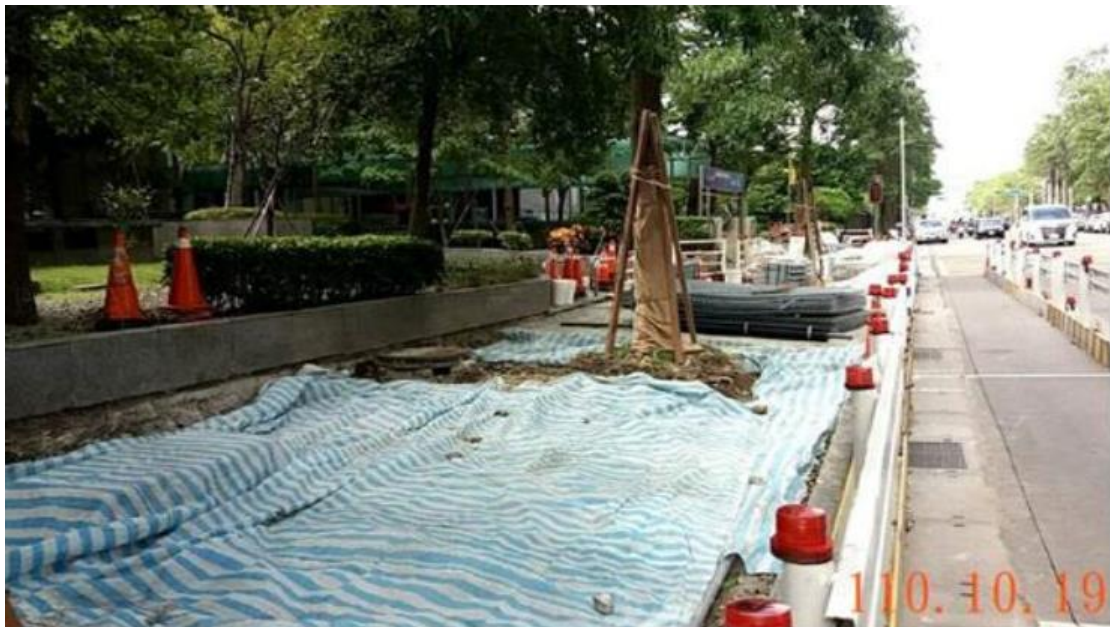
圖 優良案例示範圖