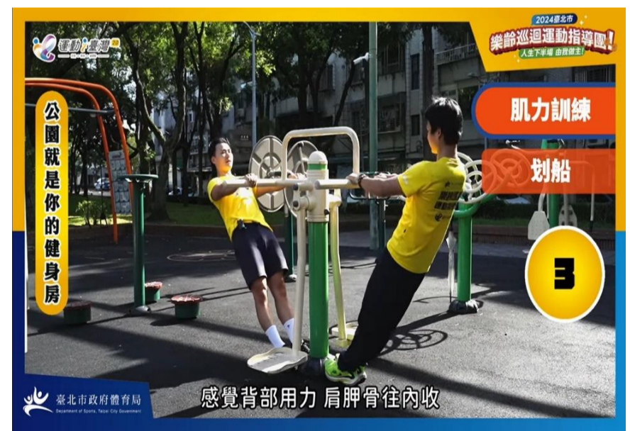
線上教學影片 ♥ -肌力訓練-公園就是你的健身房