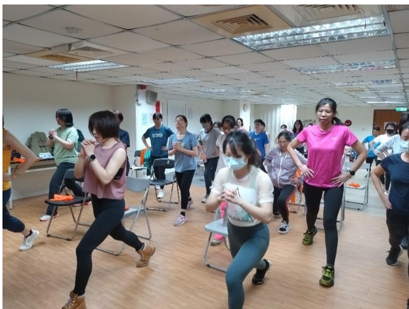
上班族女性必備體態雕塑課