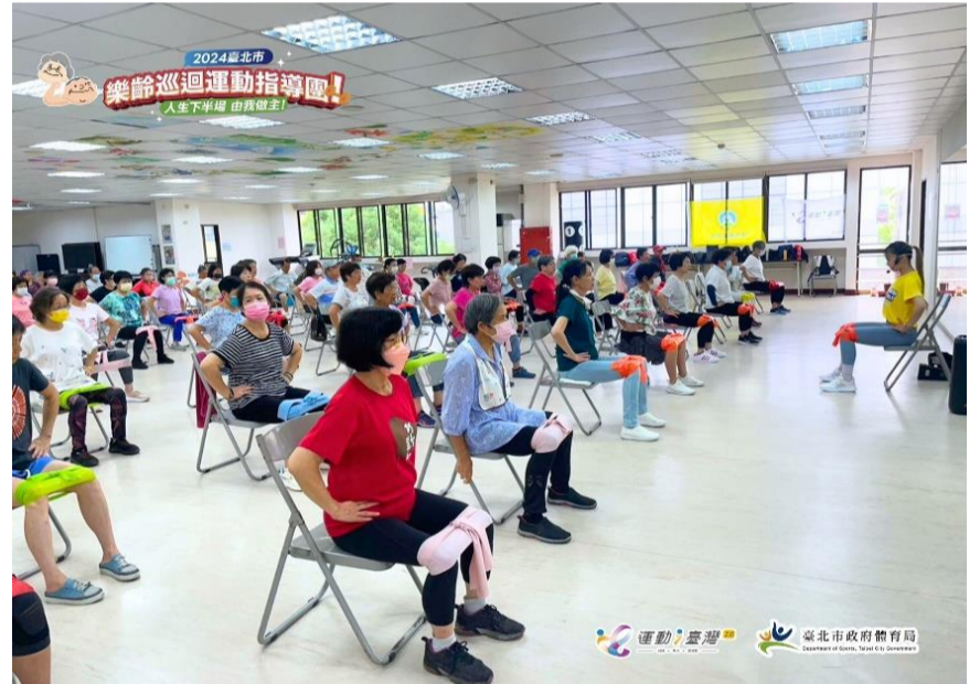
廣納申請師資外送 ♥ 內湖湖興里辦公處一起運動吧!