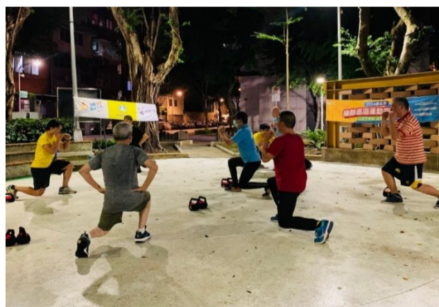
主動出擊-父親節快閃活動~大同區德鄰公園 一起運動爸

於父親節特別為男性長輩設計專屬的運動課表，讓爸爸們體驗最不一樣的父親節，健康就是最棒的禮物！。FB 粉絲專頁連結： https://zh-tw.facebook.com/TPEseniorsport/ 。