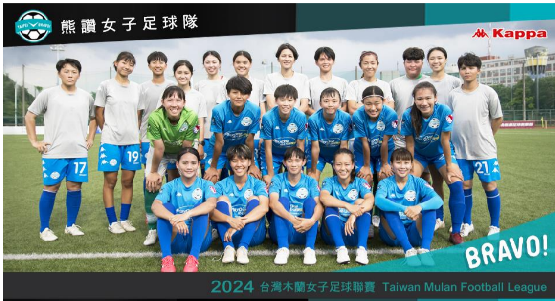
臺北熊讚女子足球隊宣傳海報

藉由冠名女子職業隊伍，提供球隊各項行政資源挹注，展現本市支持女性參與職業運動之決心與行動。