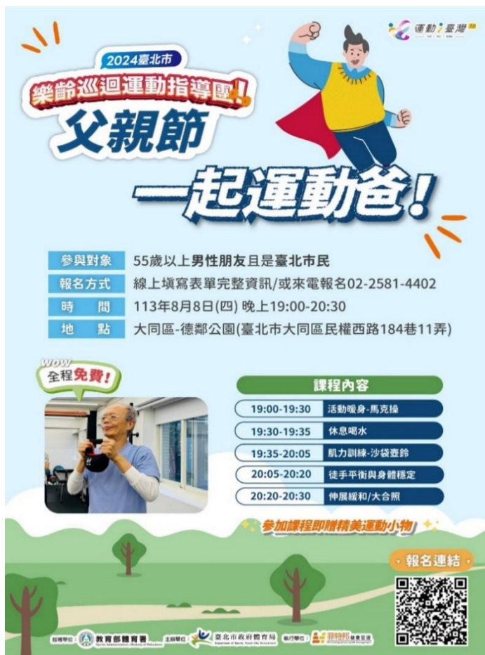
父親節 一起運動爸 宣傳海報