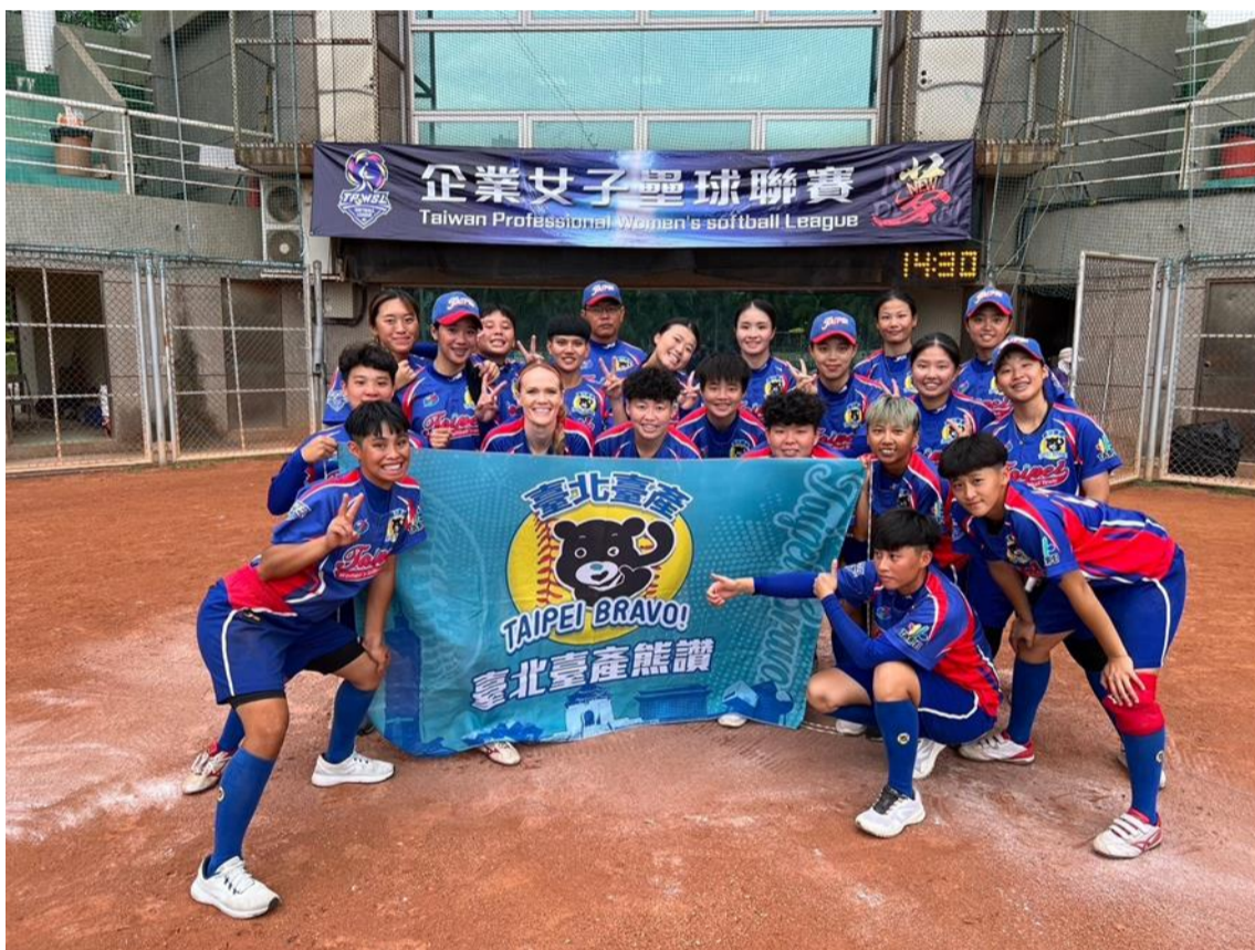
臺北臺產熊讚女子壘球隊宣傳圖像