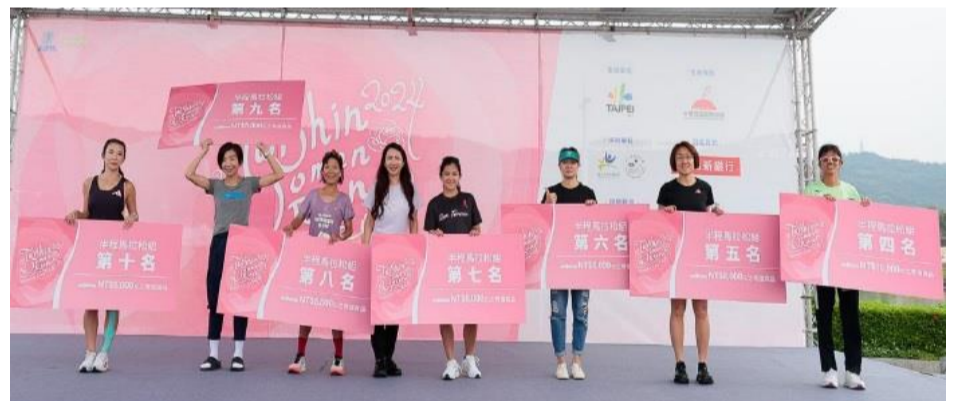
完賽後主舞台頒獎