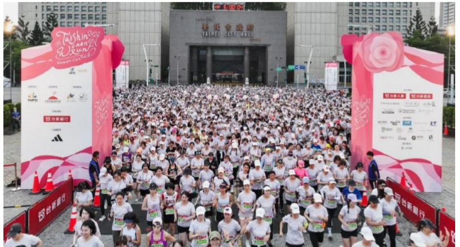
臺北市政府前市民廣場（起點）