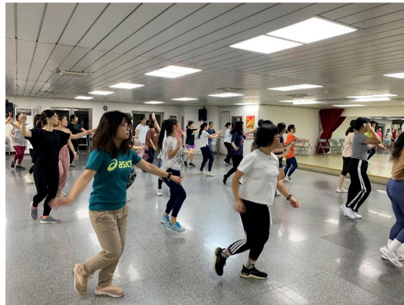
女力之夜-夜間螢光 ZUMBA