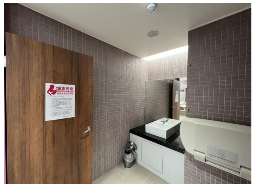
運動中心哺集乳室及親子盥洗室