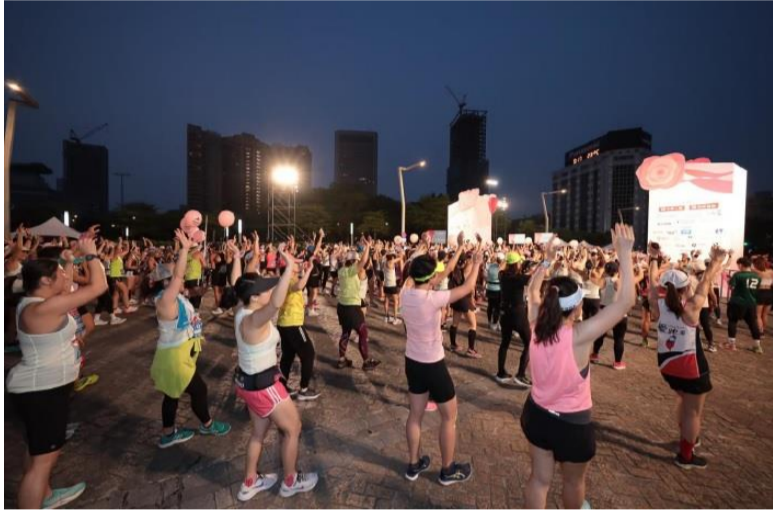
起跑前暖身操時間

「2024 Taishin Women Run 台新女子路跑」為亞洲年度最大型女子路跑盛會之一，由中華民國路跑協會主辦、本局為協辦單位，活動分為半馬組、10 公里組及 3 公里組。其中也規劃許多女性專屬服務，像是女孩梳妝區、美甲塗裝區、美髮編織區、瑜珈放鬆區及貼心更衣室等，更設有各式拍照打卡區。活動參與人數半馬組 3,770 人、10 公里組 3,421 人、3 公里組 1,506，總人數共 8,697 人。從 2011 年中華民國路跑協會第一次舉辦全女性的路跑開始，這十年來透過女生路跑，成功讓全台的女生更願意主動投入運動。