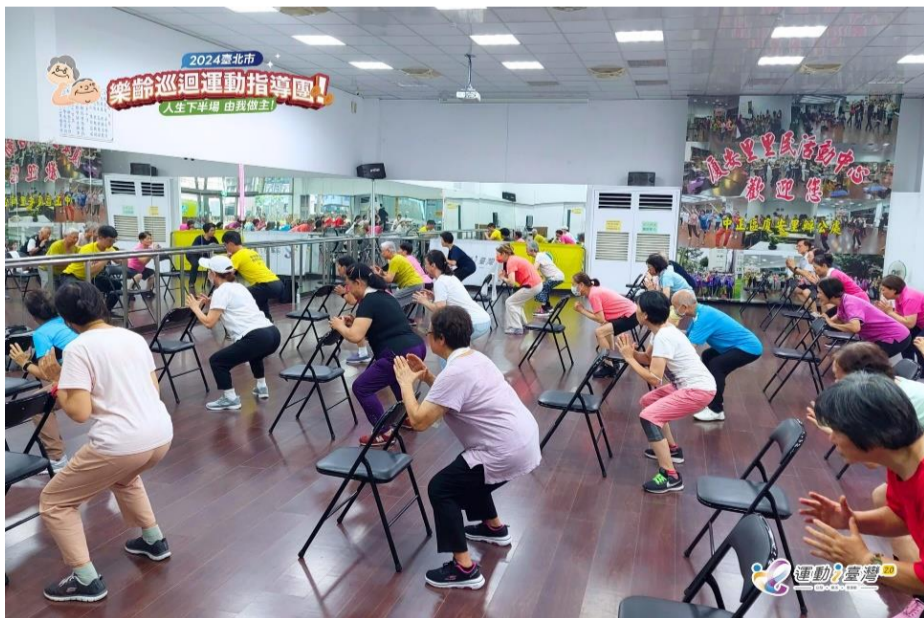
樂齡據點通路 ♥ 中正區廈安里辦公處 一起運動吧