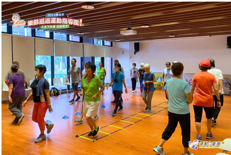
常態性課程 ♥ 北投區北投老人服務中心 一起運動吧!