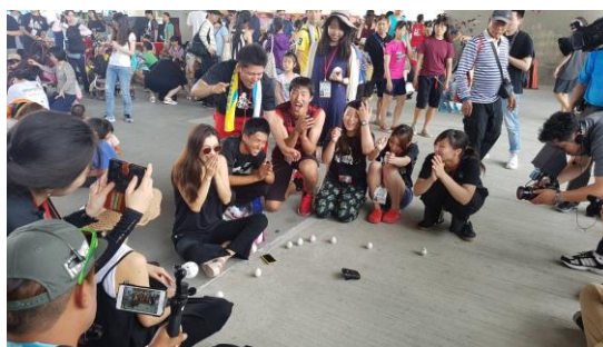
日本愛媛縣松山市龍舟隊參加立蛋活動