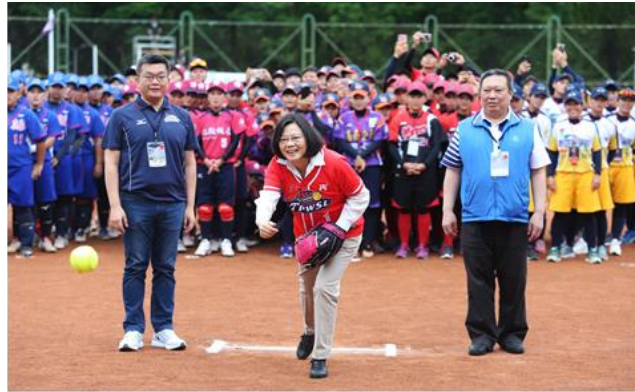
【蔡英文總統蒞臨開球】

今年邁入第 2 屆舉辦，參賽球隊由 4 隊增至 5 隊，精彩賽事全程網路直播，並由福斯體育台(ESPN)轉播六、日賽程，除積極推展本市壘球運動，亦透過以賽代訓的方式，以進軍 2020 東京奧運為目標。106 年 5 月 26 日開幕式，蔡英文總統也親臨現場擔任開球嘉賓，為賽事拉開序幕，也期盼女壘能在 2020 年東京奧運為臺灣奪下獎牌。