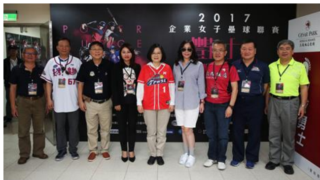
【蔡英文總統力挺女壘運動，期勉進軍東京奧運】