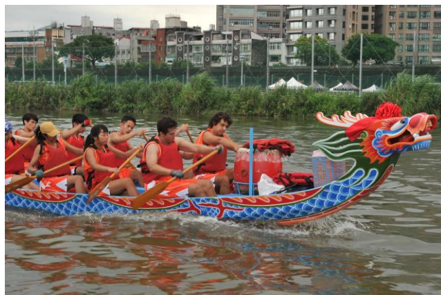
【氣宇軒昂的手工木造龍舟】