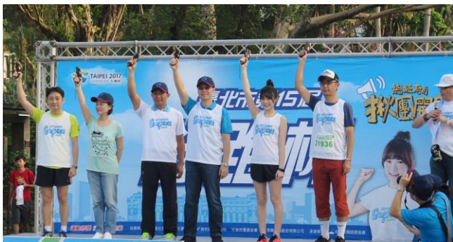
【鳴槍起跑迎向第 15 屆舒跑杯】