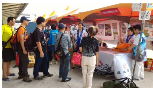
日本愛媛縣松山市於賽事會場設攤，民眾參與踴躍