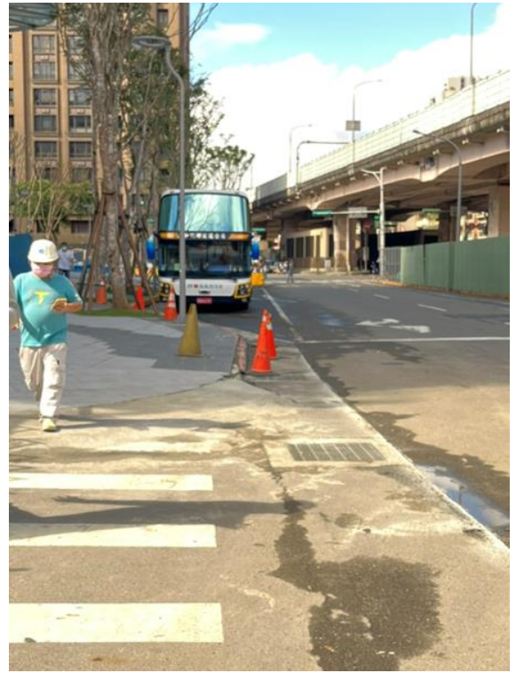
照片10 - 人行道鋪面與路緣石有高低差