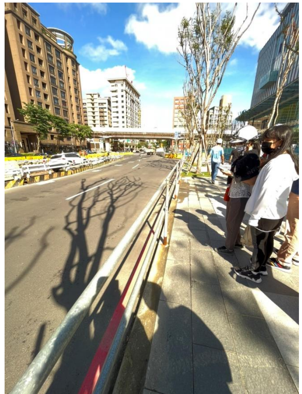
照片8 - 新闢車道路旁圍設之護欄