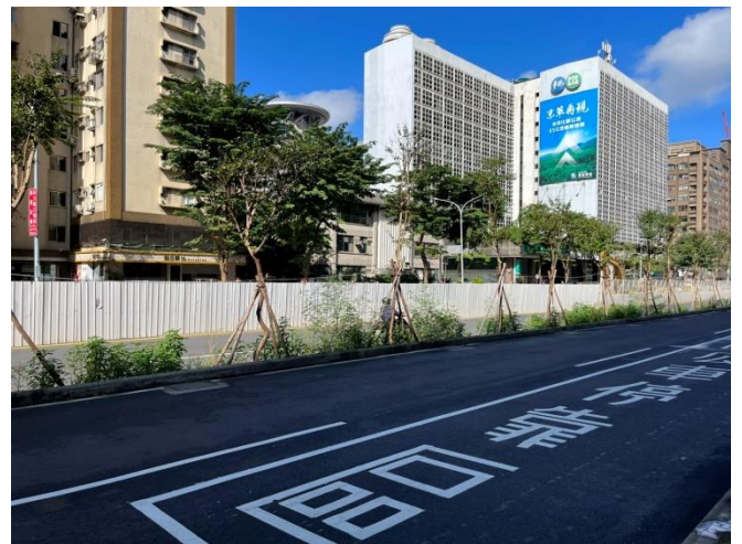
照片4 - 分隔島雜草叢生