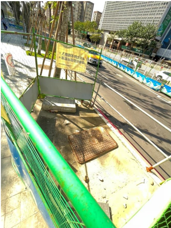
照片7 - 手孔蓋周邊尚未填平