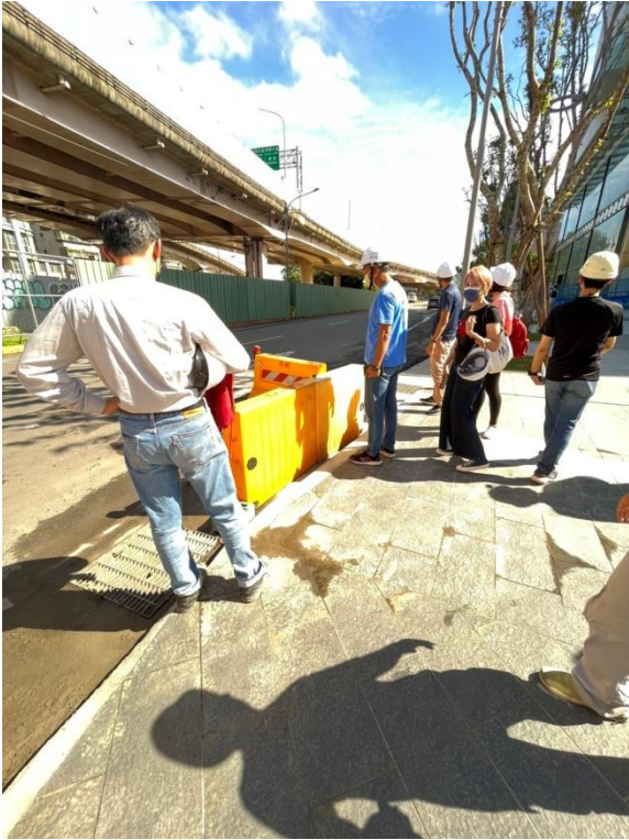
照片9 - 置放充水式紐澤西護欄占用道路