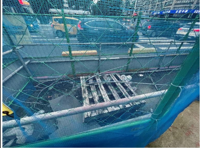
照片2 - 堆置工程雜物及廢料