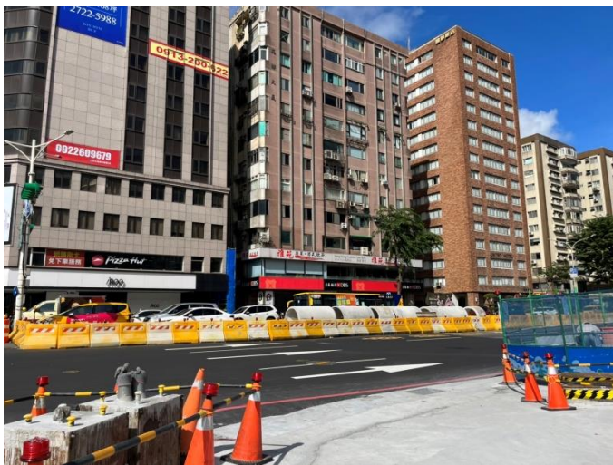
照片3 - 占用道路堆置工程用料