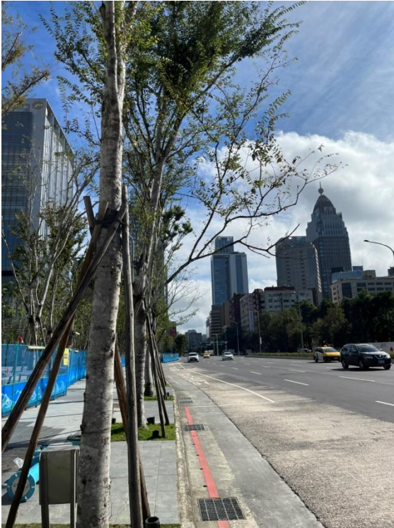
照片1 - 喬木枝葉伸展至車道上空