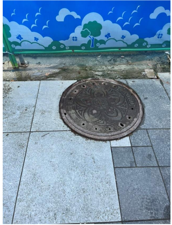
照片6 - 蓋頂未與鋪面齊平