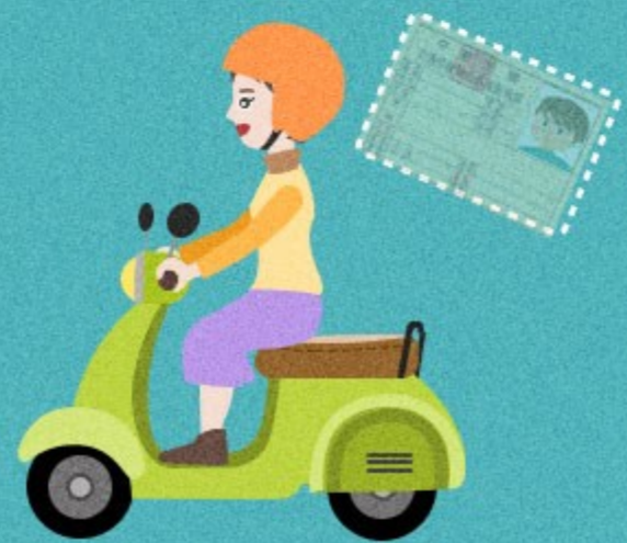
無照駕駛小型車 或機車