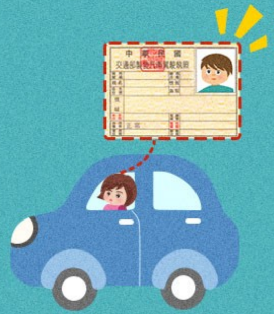
持偽造、變造或 矇領的駕照駕車