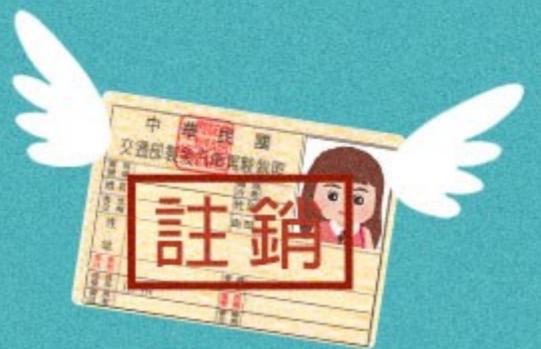
駕照已吊銷、 註銷仍駕車