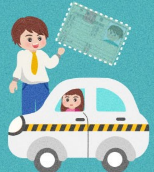
無駕照，卻以教導 他人駕車為業