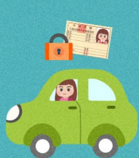
駕照吊扣期間 仍駕車