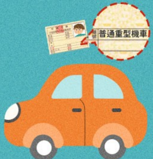
持機車駕照 駕駛小型車