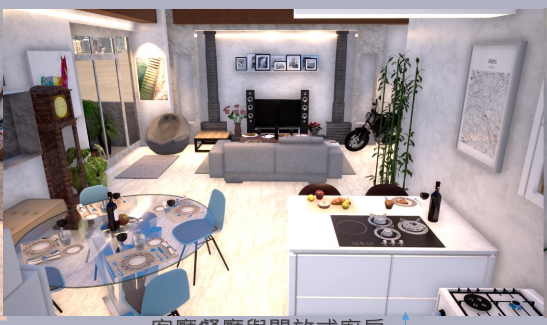
客廳餐廳與開放式廚房