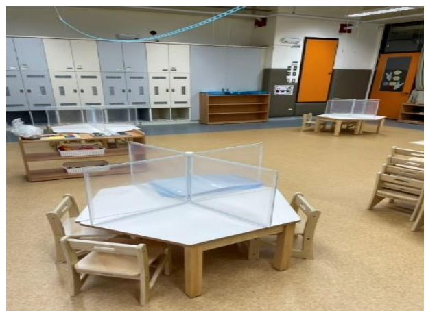
延平國小附幼防疫隔板成品