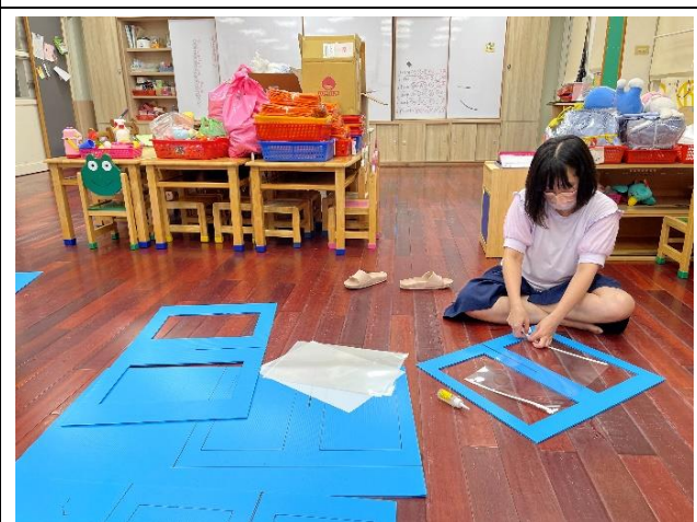
建安國小附幼教師製作防疫隔板