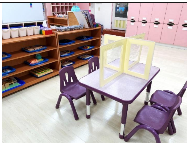
大安幼兒園防疫隔板成品