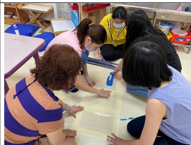
大安幼兒園教師製作防疫隔板