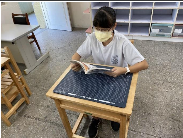
懷生國中學生使用防疫隔板