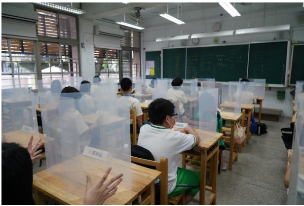
古亭國中學生使用防疫隔板