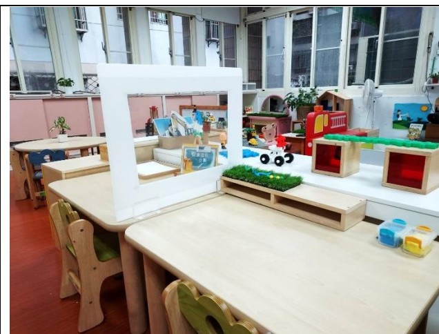
中山幼兒園防疫隔板成品