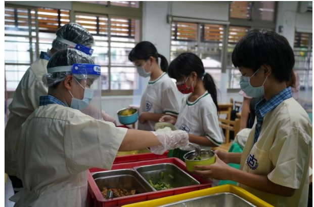
古亭國中打菜小天使分配食物