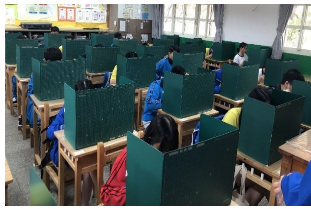
懷生國中學生使用防疫隔板