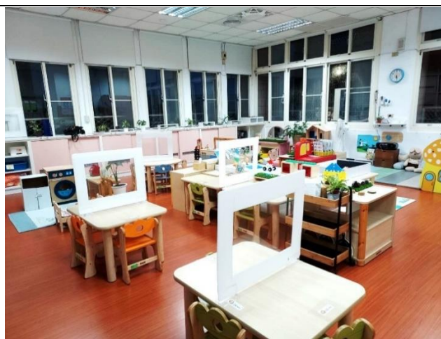
中山幼兒園防疫隔板成品