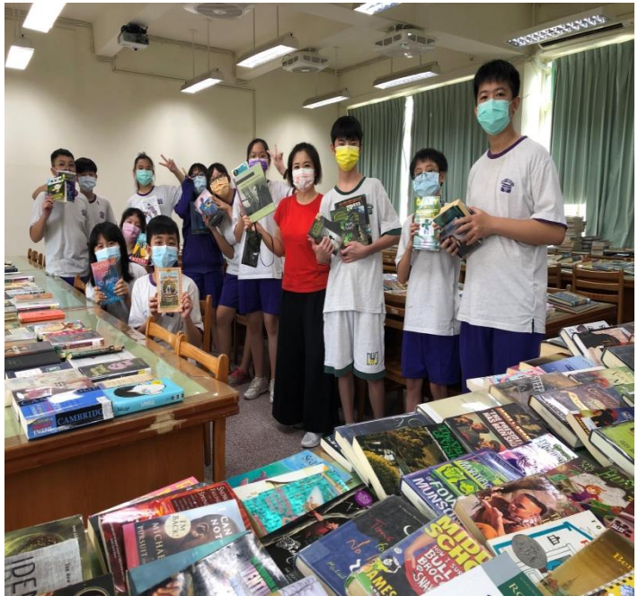
▲我的第一本英文小說，我要好好珍惜。