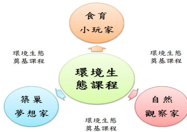
環境生態課程架構圖

「美創博嘉」素養為本校課程的重要價值，「環境生態課程」係將現有自然科領域注入「美感力、創造力、思考力、行動力」內涵所重新建構的課程(如下圖)，著重於知識學習轉化為生活實作的應用與反思，從孩子的生活經驗出發，將課堂所學的知識與生活情境互為印證，從愛自己、愛他人進而能理解環境、關懷環境進而實踐改善環境。除「環境生態奠基課程」外，另發展出三大學習主題，部分課堂以協同合作進行教學，學生藉由小組合作及團隊實踐學習任務，培養覺知問題的敏銳度與問題解決的能力，透過「美感學習-創意激發-反思修正-轉化行動」的學習歷程，落實環境生態課程學習的意義。