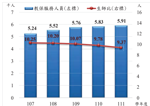
臺北市教保服務人員及生師比概況