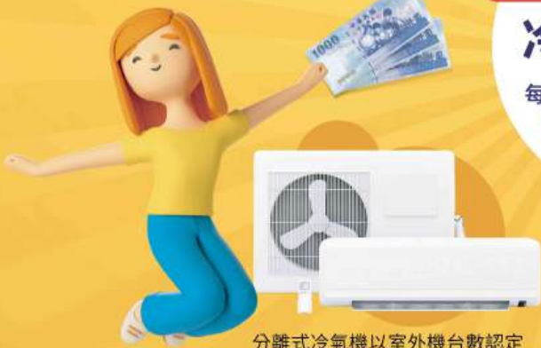
分離式冷氣機以室外機台數認定