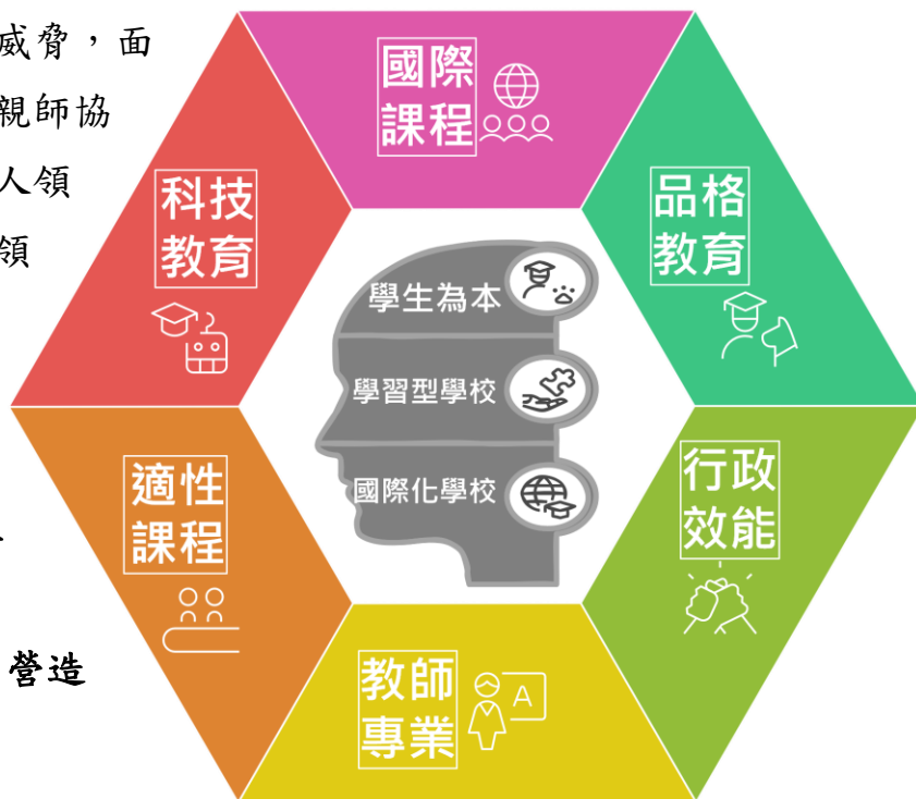
「大氣洛城.大器中正人」學校經營策略圖