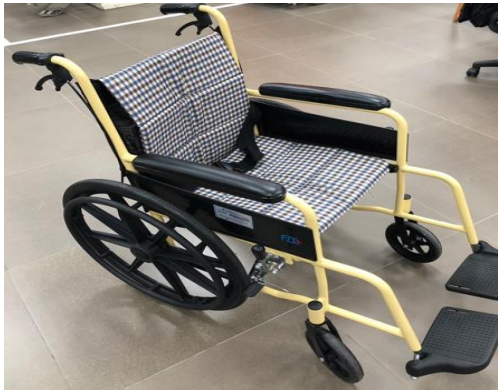
圖例 1：輕量化量產型輪椅