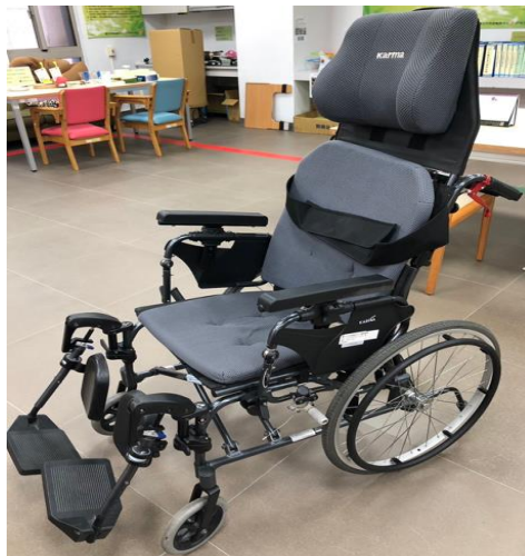
圖例 3：輪椅-具附加功能具利於仰躺