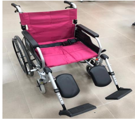
圖例 2：輪椅-具附加功能具利於移位