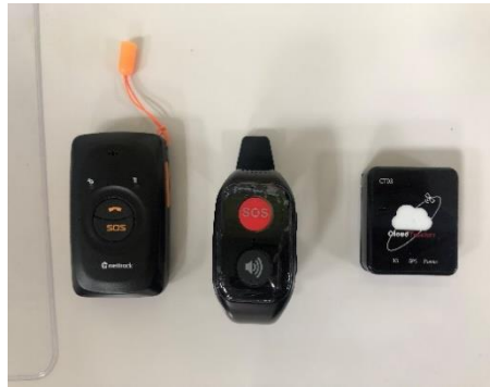
圖例：感應器及監測裝置