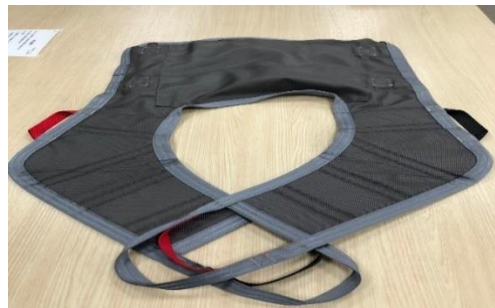
圖例 2：人力移位吊帶