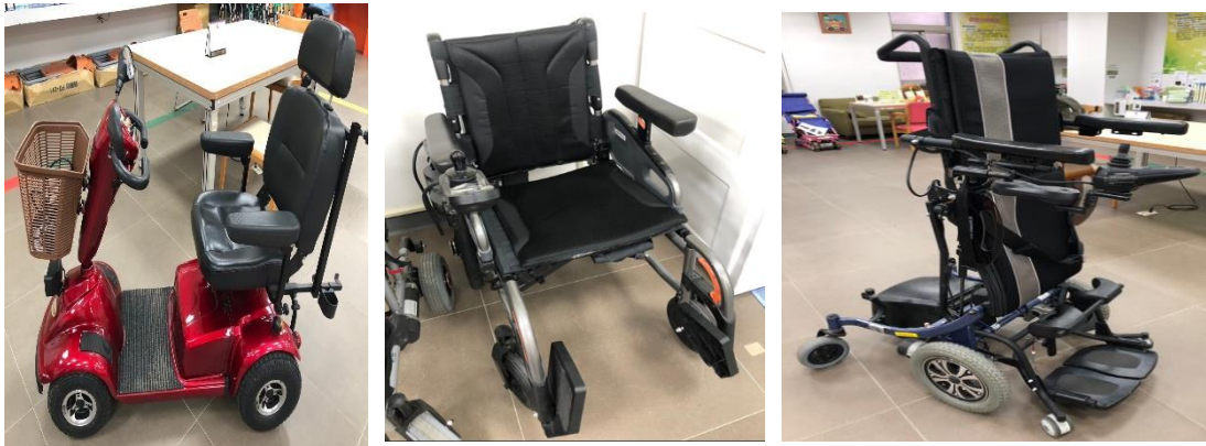
圖例 1：電動代步車 圖例 2：一般型電動輪椅 圖例 3：具電動變換姿勢功能之電動輪椅