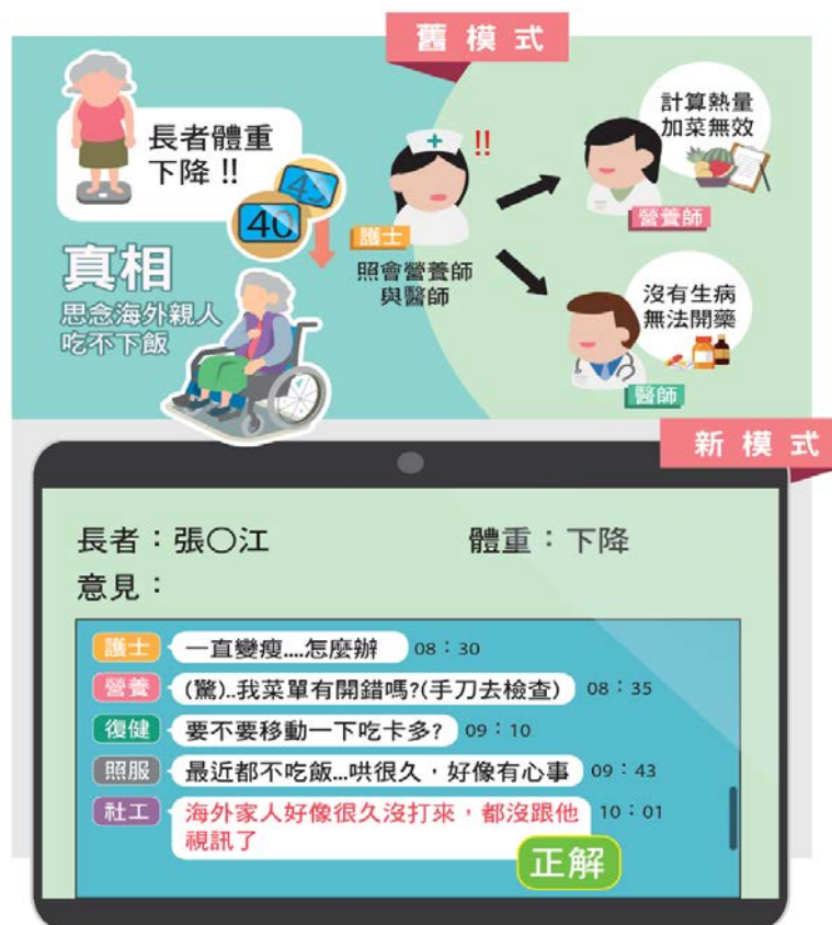
圖7：機構個案管理系統導入資通訊(ICT)科技應用，模式示意圖