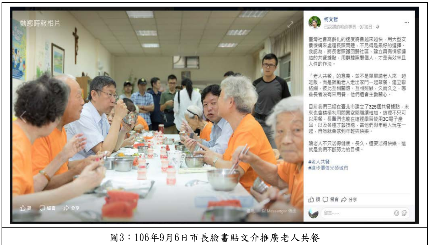
圖3：106年9月6日市長臉書貼文介推廣老人共餐

有關社區型老人照顧，本府於105年12月於68個行政次分區皆佈建各類型老人活動據點，其中65個行政次分區有老人共餐據點。各類型老人活動據點截至106年12月底共計377處，並達成88處老人活動據點升級，提供多項關懷、健康促進服務，其中部分增加提供日托服務。本府社會局鼓勵老人活動據點自主辦理老人共餐，並補助相關設備、食材及人力經費，截至106年12月底，已達成325處老人共餐據點，涵蓋243里別。