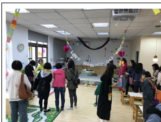
108 年 5 月實地參訪興雅家園

社區公共托育家園 107 年 8 月 6 日有別於過去登記報名模式，透過跨局處協力，運用本市臺北卡線上申辦作業，同步辦理公托登記事宜，減少行政成本提高效率，解決家長因報名登記舟車勞頓，創新現行服務模式；108 年度為精進托育服務品質，規劃家園主任及托育人員規劃課程分組討論模式，加上實地參訪課程，豐富課程內容，透過課程分流更能回應一線人員需求，另加強宣導托嬰機構內兒保宣導活動，落實托育服務品質精進及安全。