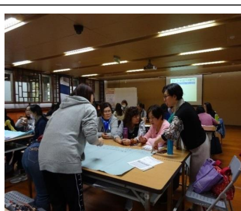
108 年實地分組研討情形