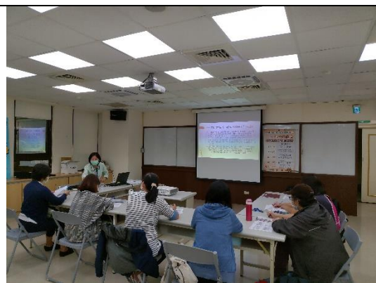
圖3：109年主管人員實地研討會議