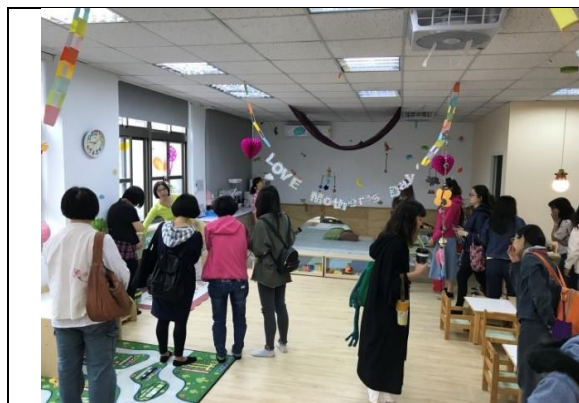
圖2：108年5月實地參訪興雅家園

社區公共托育家園107年8月6日有別於過去登記報名模式，透過跨局處協力，運用本市台北卡（109年7月改為市民大平台）線上申辦作業，同步辦理公托登記事宜，減少行政成本提高效率，解決家長因報名登記舟車勞頓，創新現行服務模式；108年度為精進托育服務品質，規劃家園主任及托育人員規劃課程分組討論模式，加上實地參訪課程，豐富課程內容，透過課程分流更能回應一線人員需求，另加強宣導托嬰機構內兒保宣導活動，落實托育服務品質精進及安全。