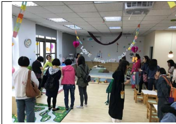
圖2：108年5月實地參訪興雅家園