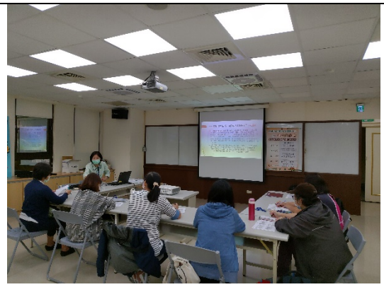
圖3：109年主管人員實地研討會議