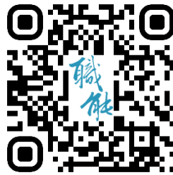
臺北市職能發展學院 官網