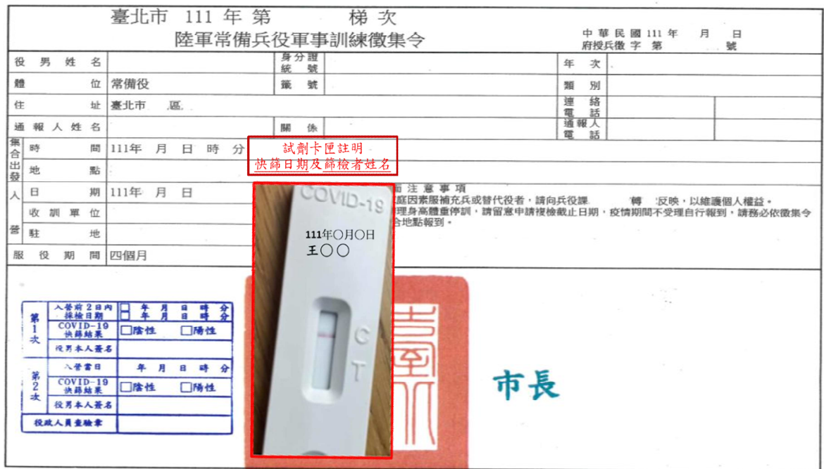
示意圖 入營日快篩(試劑卡匣註明快篩日期及本人簽名合併徵集令拍照)