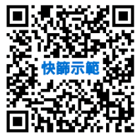
【快篩示範教學影片】