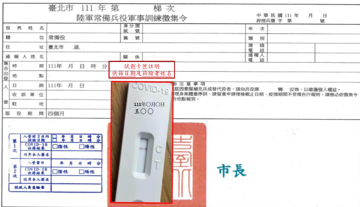
示意圖 2 入營當日-再 1 次快篩(試劑卡匣註明快篩日期及本人簽名合併徵集令拍照)