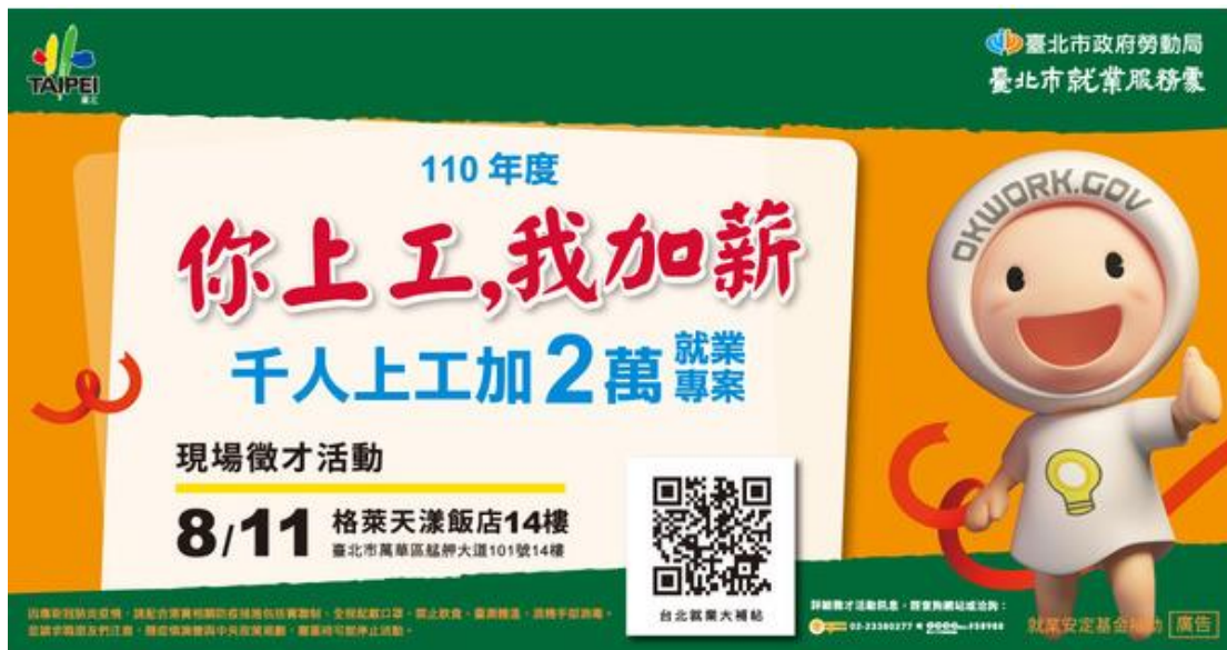
圖 2 臺北市政府推出「你上工，我加薪」勞工紓困專案