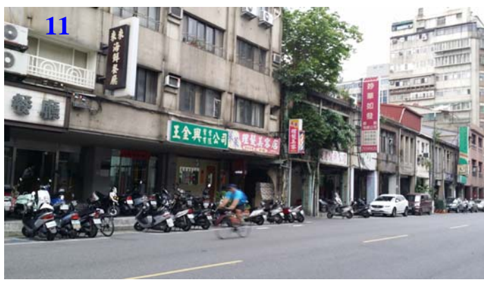
黎明興技術顧問股份有限公司 LEADERMAN & ASSOCIATES 圖 4-4 基地現況照片(續)