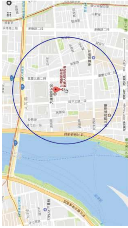
圖2：調查範圍示意圖

依據前述計畫項目，本次文化資產調查評估範圍為計畫基地及其周圍500公尺範圍，將針對此項依法規範之項目進行文化資產調查工作，並提出成果報告、評估與建議。