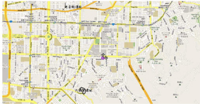
圖4 基地與遺址位置圖（吳美珍套繪於路線圖）