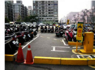
圖版 18 施工基地現況為收費停車場，停車場現皆鋪設柏油 地表，難以調查。(2011.5.21)