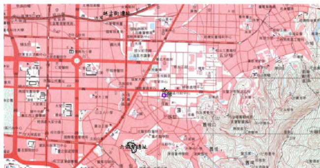
圖1 基地與遺址位置圖（吳美珍繪於1/25,000地形圖）

第一百條 公務員假借職務上之權力、機會或方法，犯第九十四條之罪者，加重其刑至二分之一。