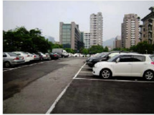
圖版 7 施工基地現況為收費停車場，停車場現皆鋪設柏油 地表，難以調查。(2011.5.21)