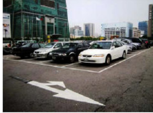
圖版 9 施工基地現況為收費停車場，停車場現皆鋪設柏油 地表，難以調查。(2011.5.21)