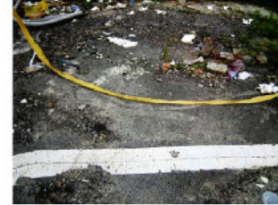
圖版 15 施工基地現況為收費停車場，但在基地東邊一隅， 出露一些灰黑色偏泥質土壤，土壤下仍見柏油鋪 面，查看其土壤，可見許多細碎建築遺留。 (2011.5.21)