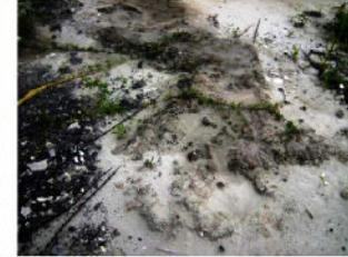
圖版 16 施工基地現況為收費停車場，但在基地東邊一隅， 出露一些灰黑色偏泥質土壤，土壤下仍見柏油鋪 面，查看其土壤，可見許多細碎建築遺留。 (2011.5.21)