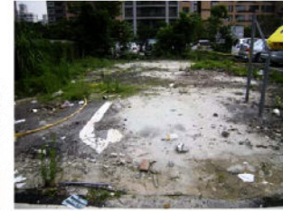
圖版 14 施工基地現況為收費停車場，但在基地東邊一隅， 出露一些灰黑色偏泥質土壤，土壤下仍見柏油鋪 面，查看其土壤，可見許多細碎建築遺留。 (2011.5.21)