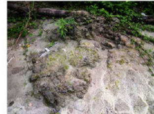
圖版 17 施工基地現況為收費停車場，但在基地東邊一隅， 出露一些灰黑色偏泥質土壤，土壤下仍見柏油鋪 面，查看其土壤，可見許多細碎建築遺留。 (2011.5.21)