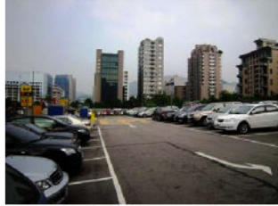
圖版 10 施工基地現況為收費停車場，停車場現皆鋪設柏油 地表，難以調查。(2011.5.21)