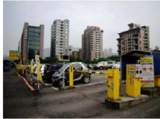
圖版 12 施工基地現況為收費停車場，停車場現皆鋪設柏油 地表，難以調查。(2011.5.21)