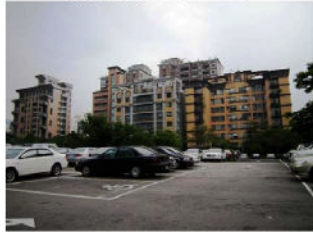
圖版 11 施工基地現況為收費停車場，停車場現皆鋪設柏油 地表，難以調查。(2011.5.21)