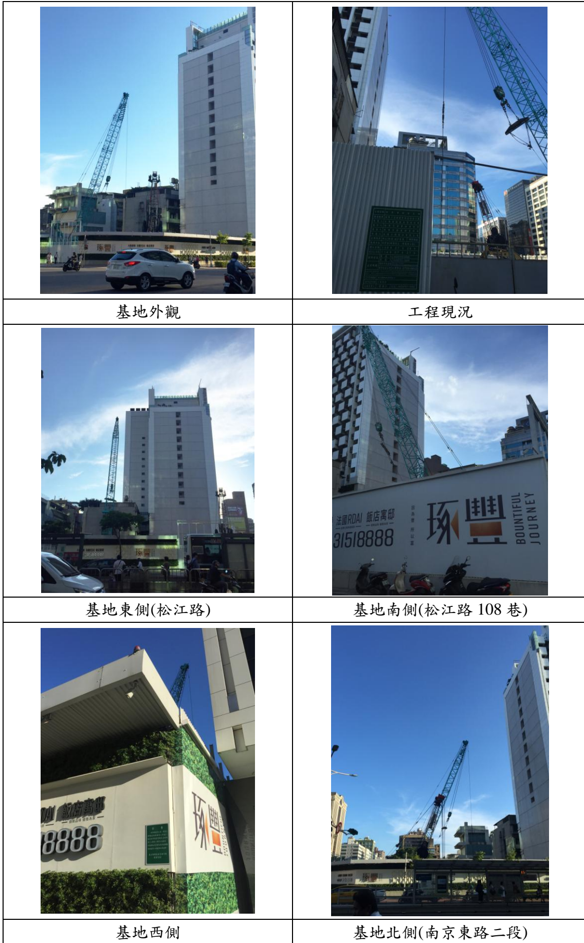
表 3-3 基地現況照片