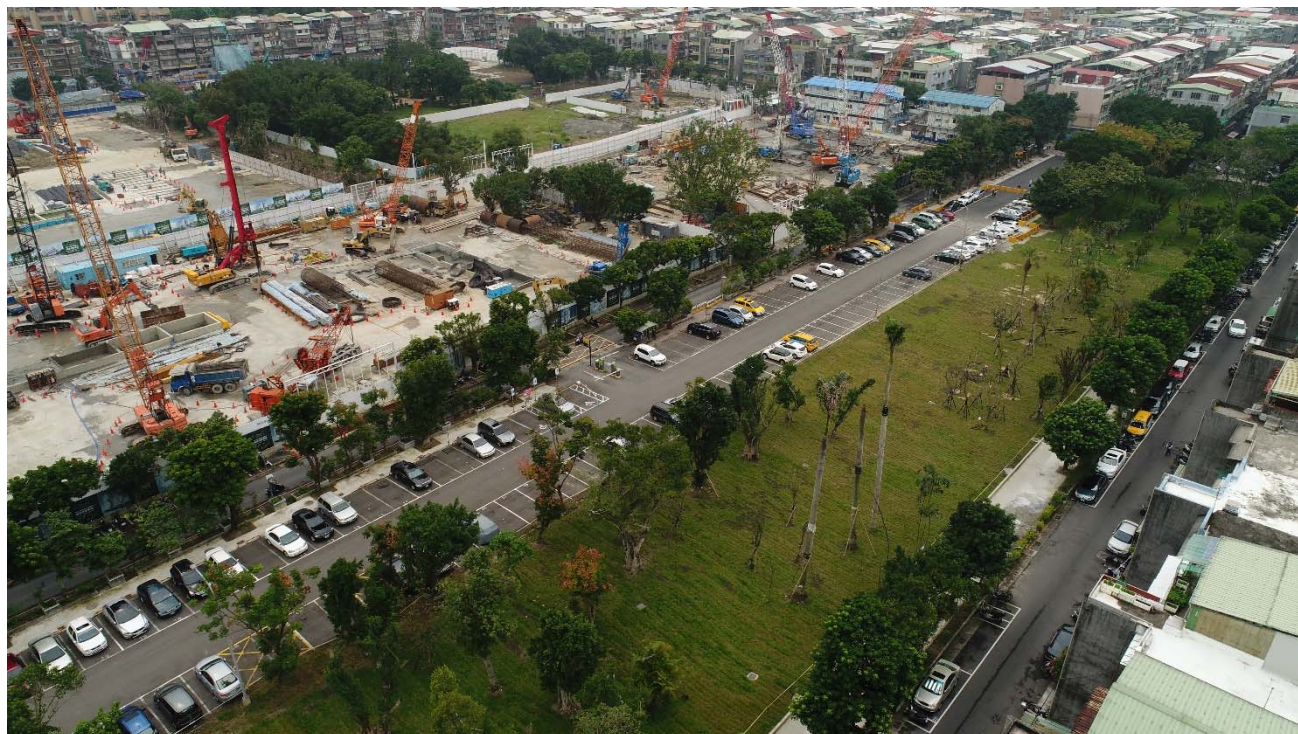
圖 3.2 基地現況照片

基地自 107 年 4 月開始施工，截至 107 年 9 月底，施工進度約為 7.4%，目前正進行連續壁雜項工程，基地現況照片詳請參閱圖 3-2。