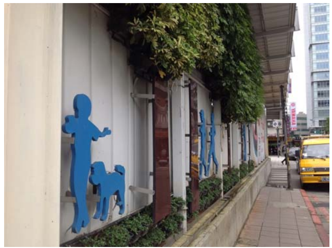
施工圍籬及防溢座照片(107年06月07日)