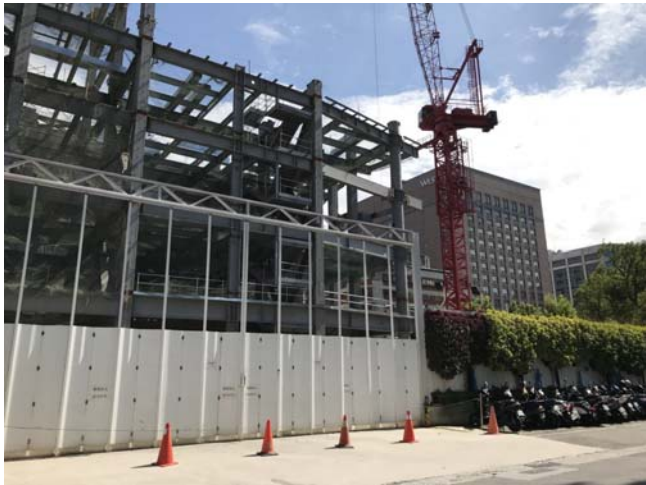
結構體施工作業照片(107年06月07日)