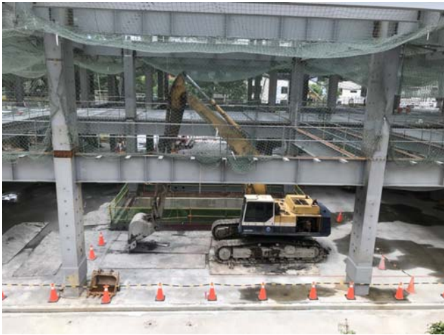
施工作業照片(107年06月07日)