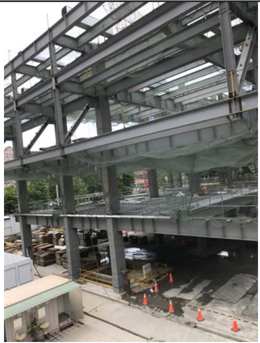
結構體施工作業照片(107年06月07日)